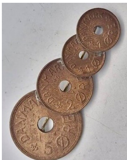
Mønter som blev brugt til et bryst-smykke.

Hvornår og af hvem mønterne præcist blev til, ved vi ikke. Måske har begge forklaringer deres del af sandheden. Måske begyndte det som enkeltpersoners handlinger og blev senere taget op i større skala af Kommunistpartiet.