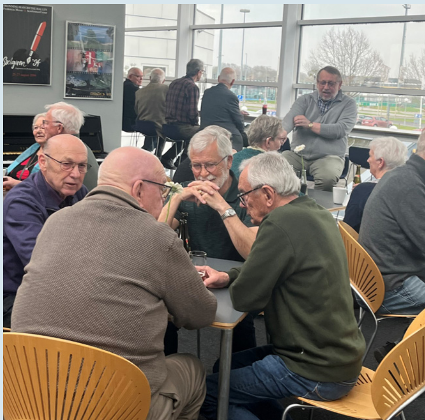
Hyggeligt samvær blandt deltagerne

I 2025 fortsatte vi med at køre videre med alle de kendte aktiviteter, som