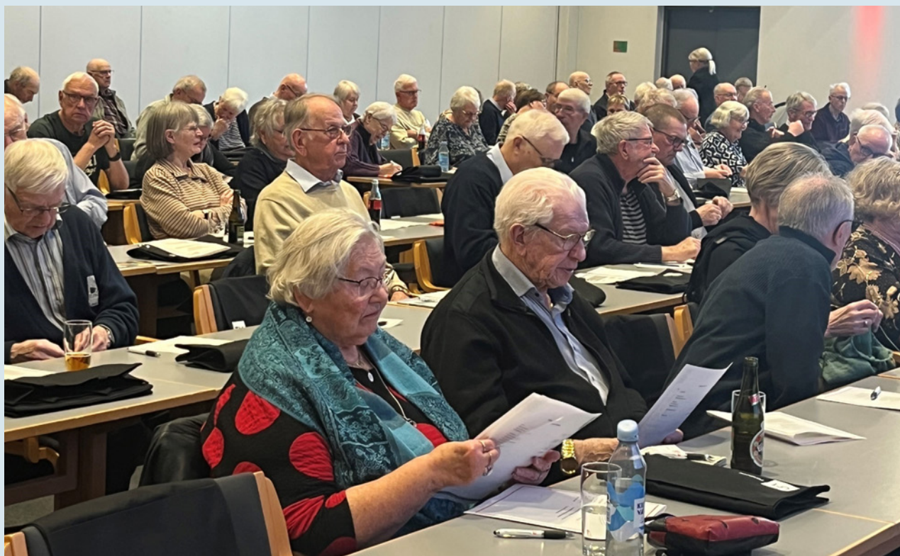
Et udsnit af deltagerne.

vi plejer. Men det er heller ikke en hemmelighed, at vi nu for alvor kan mærke, at medlemstallet falder, selv om der også kommer nye medlemmer til. Vi er nu 48 klubber og medlemstallet er i dag 3351.