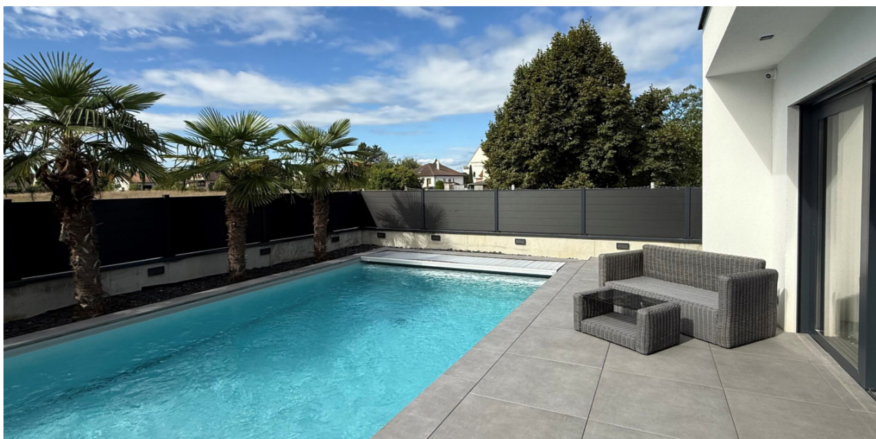
3F's medlemsbolig i Marckolsheim, Frankrig.