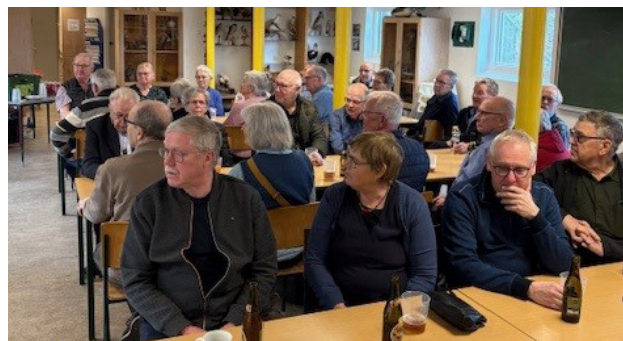
Der bliver lyttet til foredraget af deltagerne.