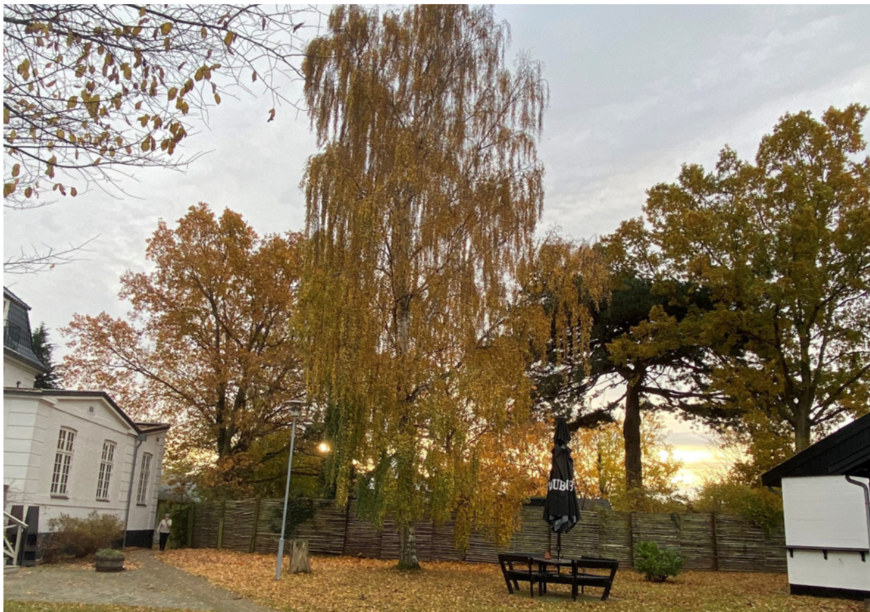
Rørvig Centret klædt i efterårets farver.