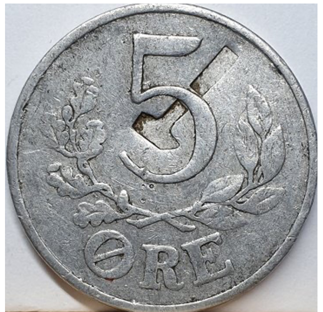
Aluminiums-femøren fra 1941, hvor der er slået en hammer ind.