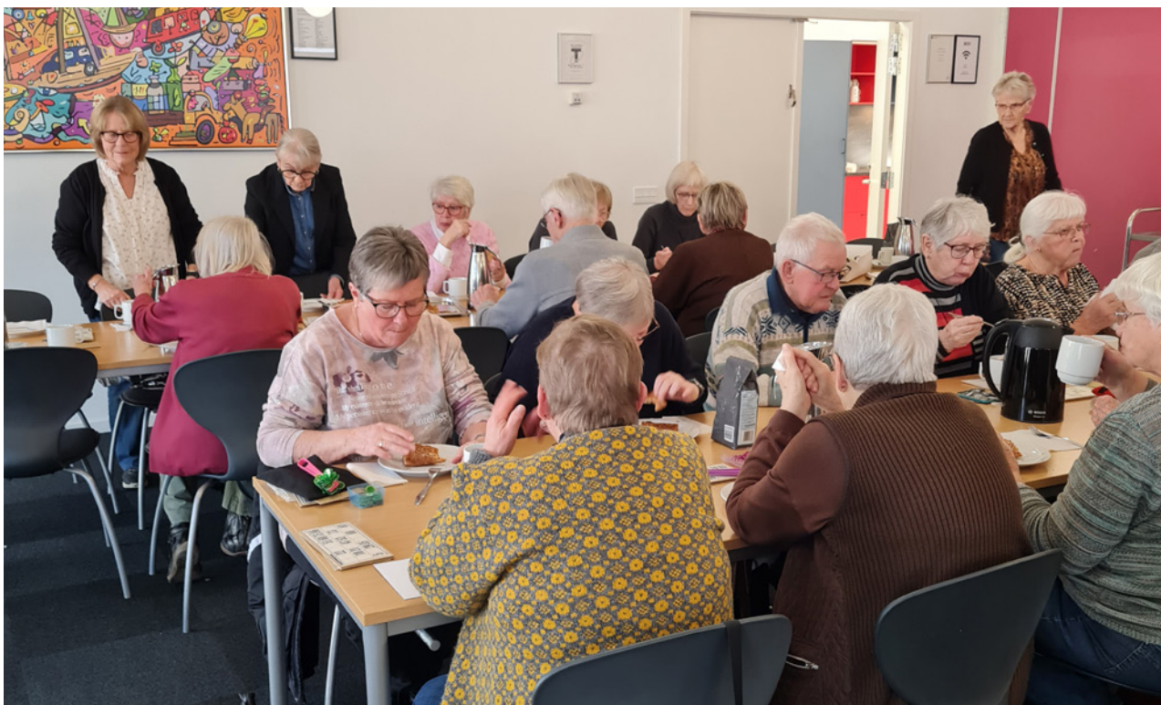
Der holdes kaffepause mellem spillene.