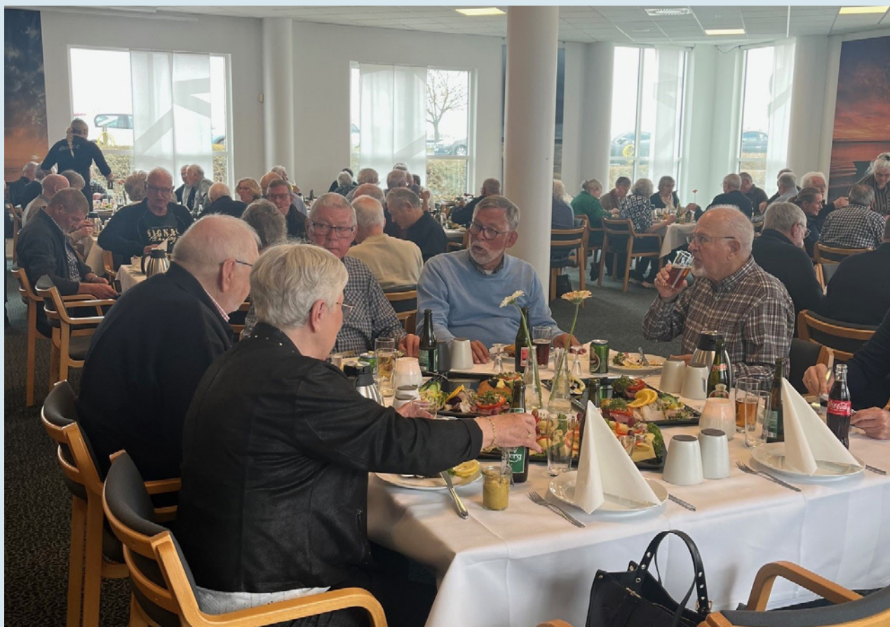
Frokost i restauranten i Messe C.