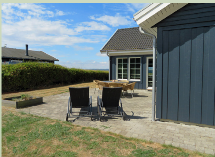
Feriehus i Martofte.

Vinderne har alle fået telefonisk besked, og er oplyst om, at legaterne er skattepligtige.