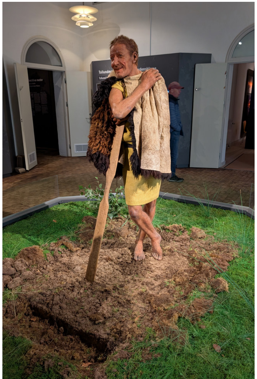
Tollundmanden som man mener han så ud, da han levede.

bunden. Der skulle skaffes husly til arbejdskraften. De skulle have noget at spise, tøj og alle andre fornødenheder.