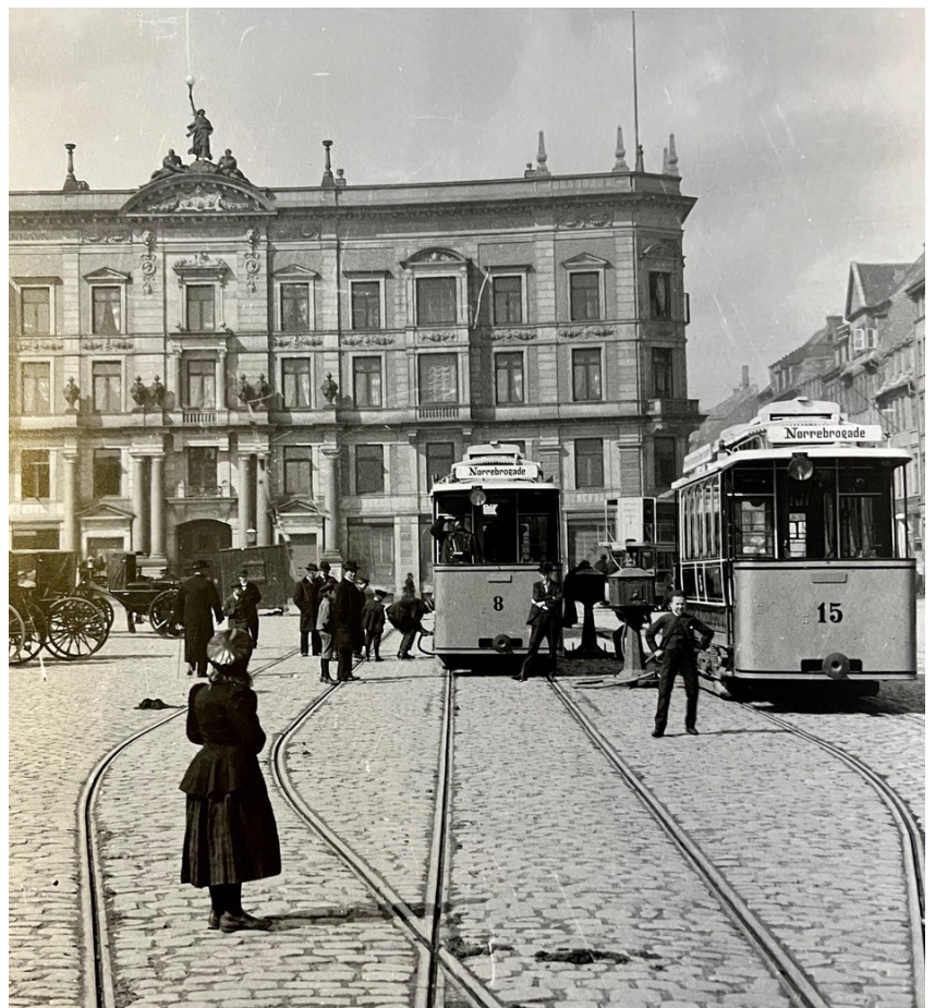
De første el-sporvogne i København var fremdrevet af et batteri.

Man kunne næsten få den tanke, at vi i Danmark er blevet så vant til de traditionelle løsninger, at vi knap bemærker, når noget nyt viser sig at være enklere, billigere og pænere i byrummet.