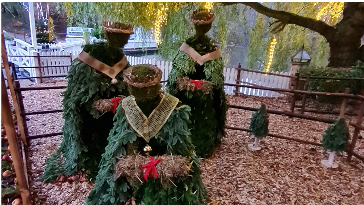
Juleudsmykningen ved Restaurant Knapp.