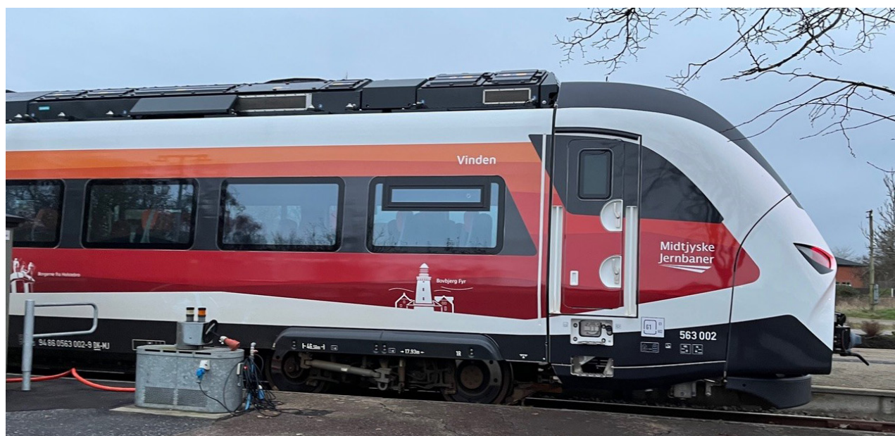
På Vemb Station står Lemvigbanen spritnye el-tog klar til afgang efter opladningen.