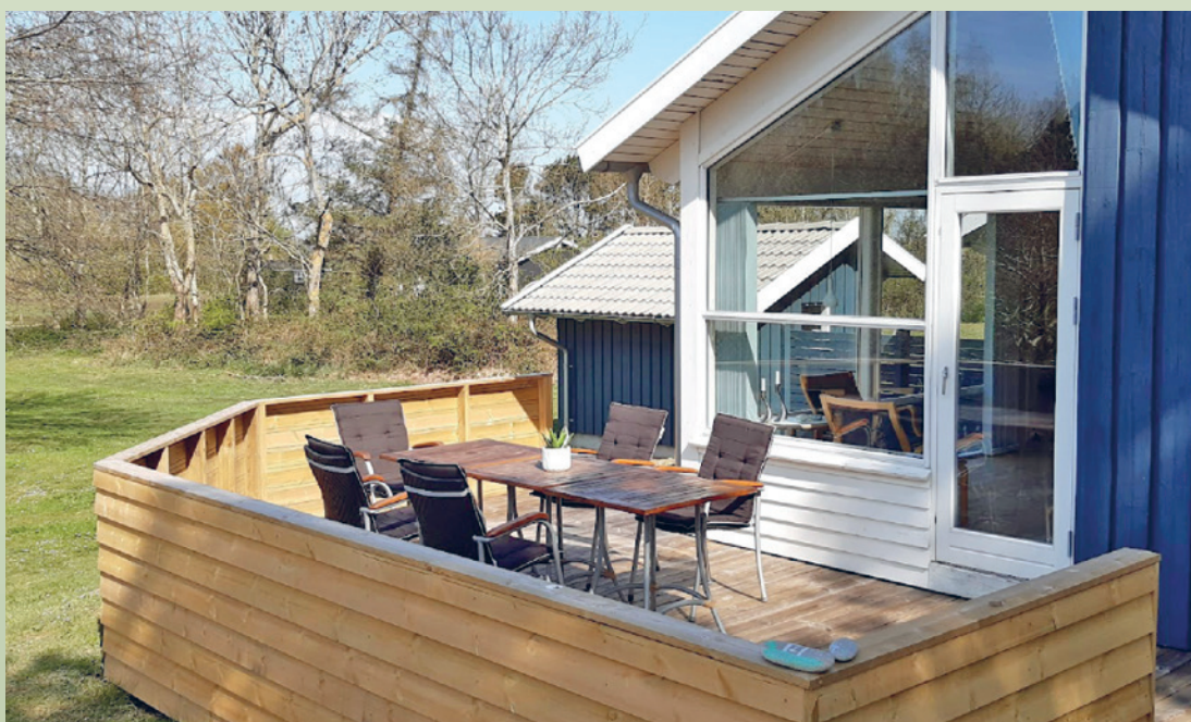
3F's sommerhus på Samsø.

Alle legater er skattepligtige, og vinderne skal selv angive beløbet på selvangivelsen.