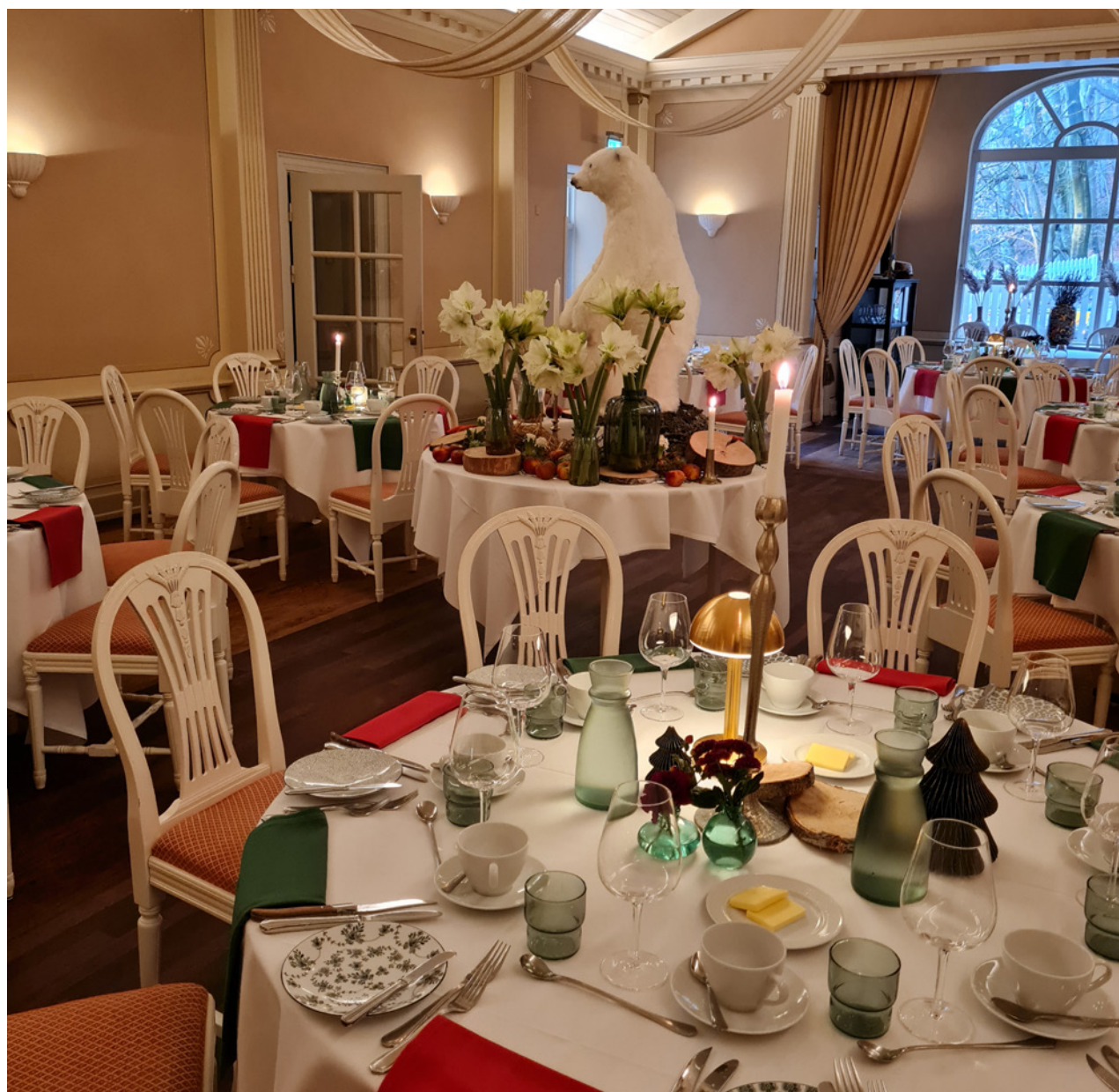
Den flotte borddækning på Restaurant Knapp.