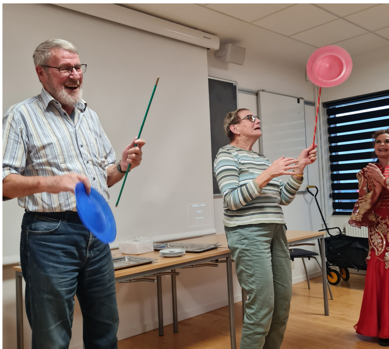
Et par deltagere forsøger sig udi kunsten.