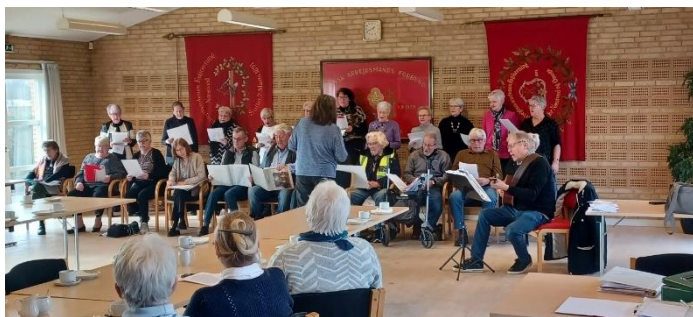
Øverst: Besøget på "Stevns Klint Experience" 2023 Nederst: Besøg af "De Glade Lunger" 2023