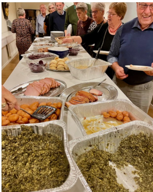
Man forsyner sig med mad