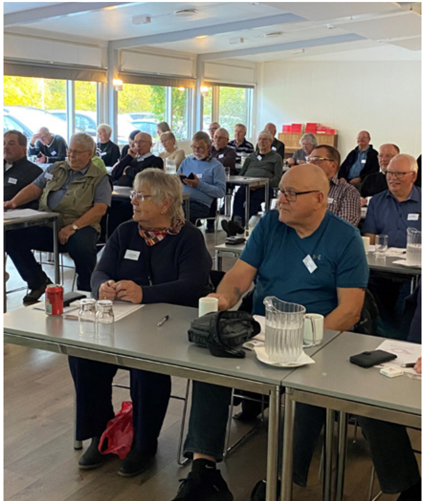
Deltagerne i foredragssalen.

Pt. har vi 50 klubber. Vi mister løbende vores lokalforeninger og det er desværre grundet manglen på formænd og/eller kasserer. Her skal der desuden lige nævnes, at fremadrettet skal enten formanden eller kassereren være med-