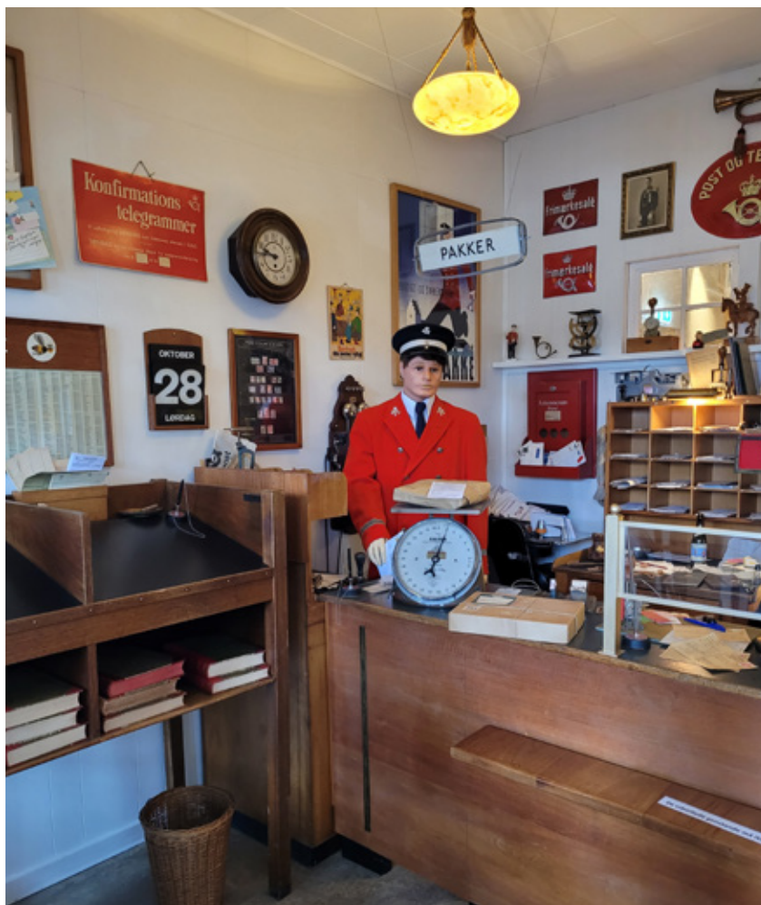
Nyopført Posthus på Thorsvang Samlermuseum.

Ønsker gæsten at nyde en kop kaffe eller en bid brød – måske skal der være fest i gaden, vil husets selskabslokaler med dets hyggelige og kreative faciliteter, være et perfekt valg.