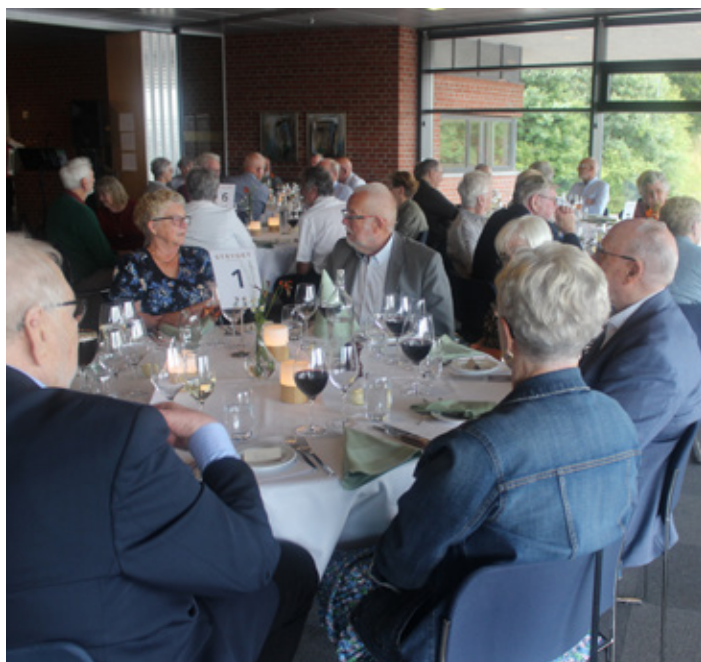
Et overblik over gæsterne.