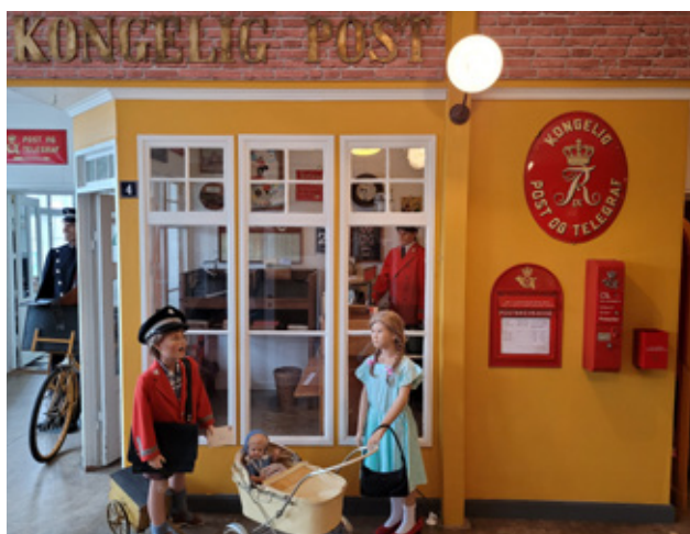
Nyopført Posthus på Thorsvang Samlermuseum.