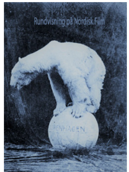
Nordisk film logo, som det så ud i 1906.