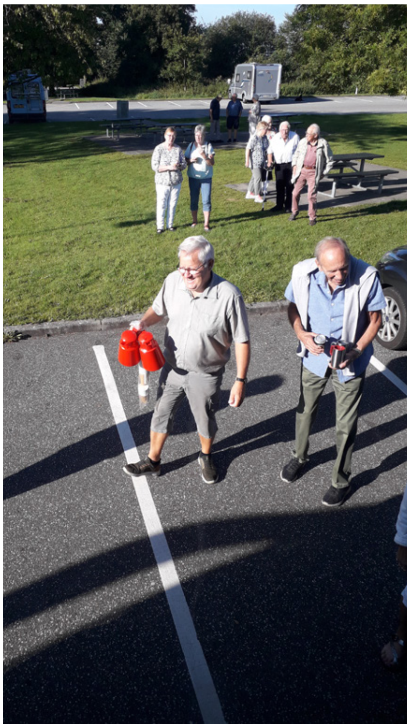
Morgenkaffe ved Lillebælt.