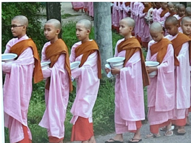
Munkene i lyserøde dragter, samler mad ind til de fattige i byen.

Han har været udsendt af FN til naturkatastrofer i østen.