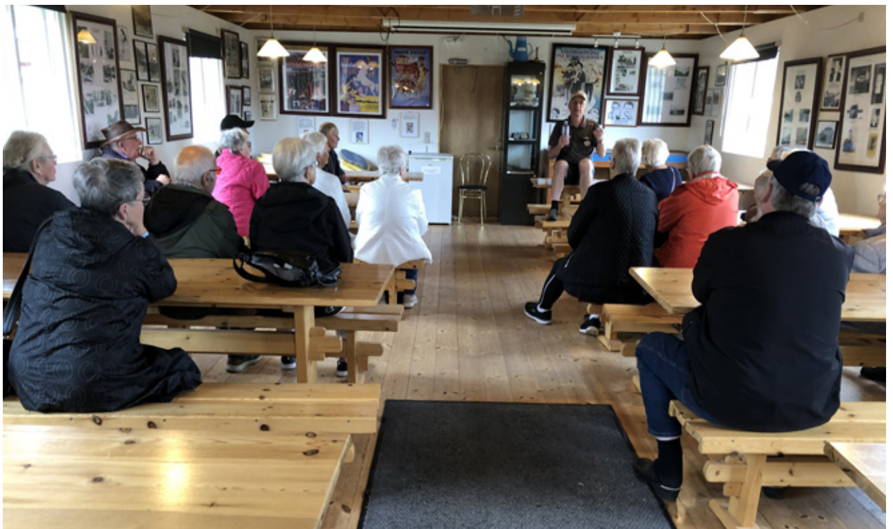
Der lyttes under foredraget ved Søby Brunkulsmuseum.