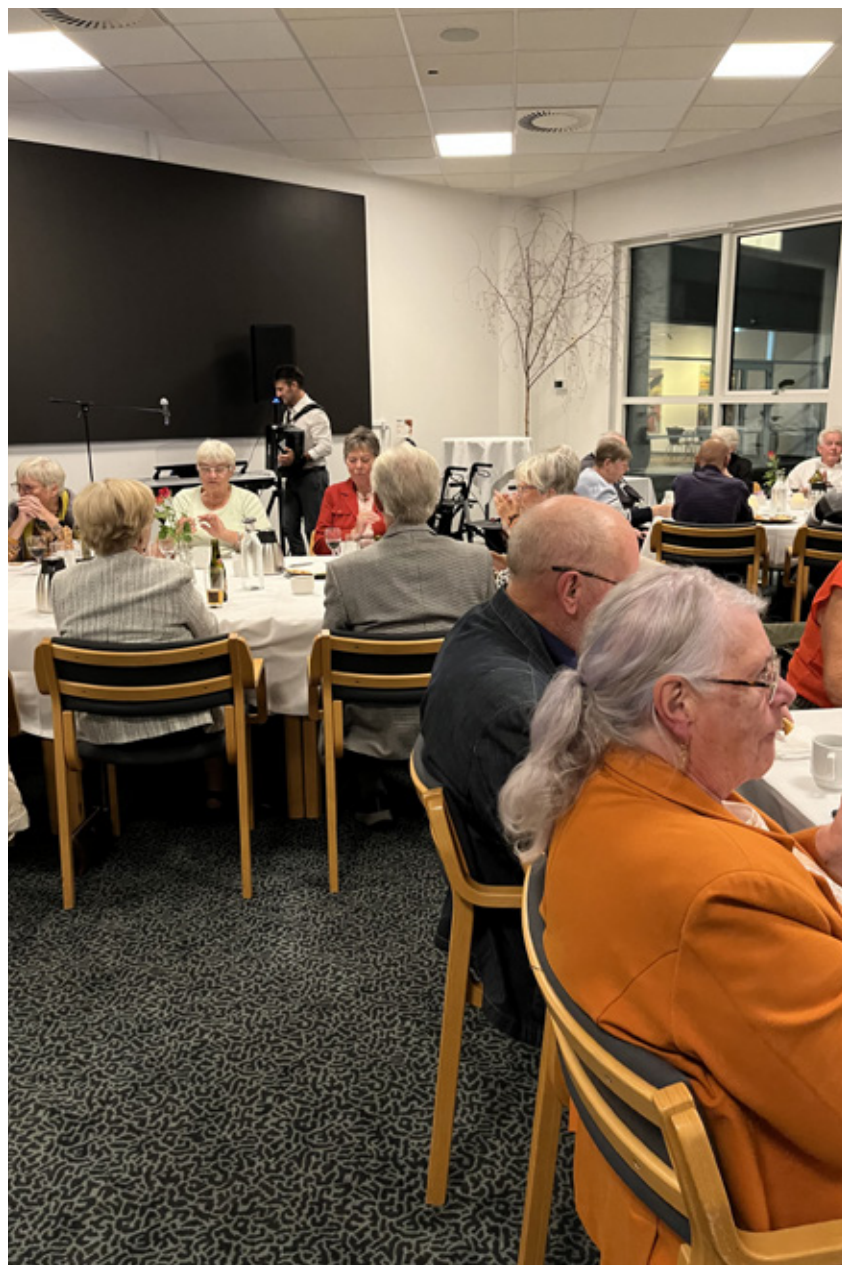
Deltagerne snakker mens der drikkes kaffe.

Tirsdag den 10. oktober blev der holdt fest i Messe C i Fredericia. Det var første gang, at vi brugte dette sted og absolut ikke sidste. Vi følte os meget velkomne, og fik en rigtig fin betjening af personalet. Der var 65 medlemmer, som deltog.