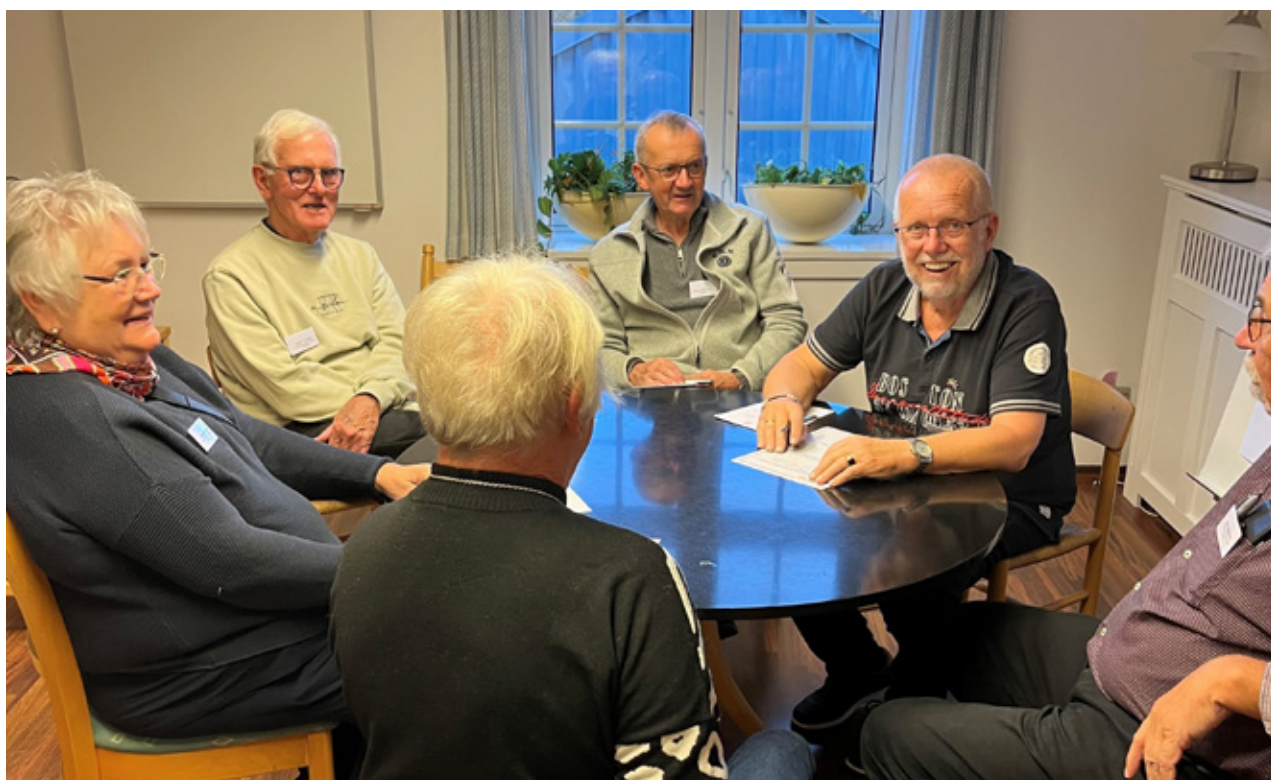
Der arbejdes og hygges i grupperne.