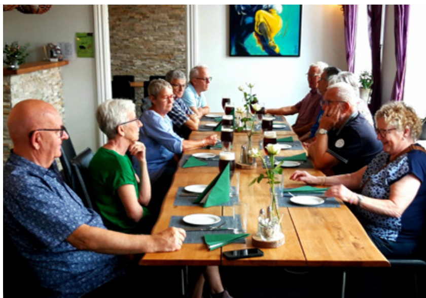
Deltagerne er klar til at spise på Gjern Hotel.