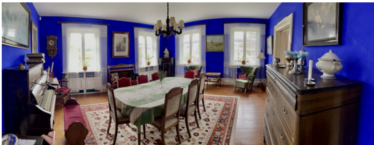
Den blå stue.