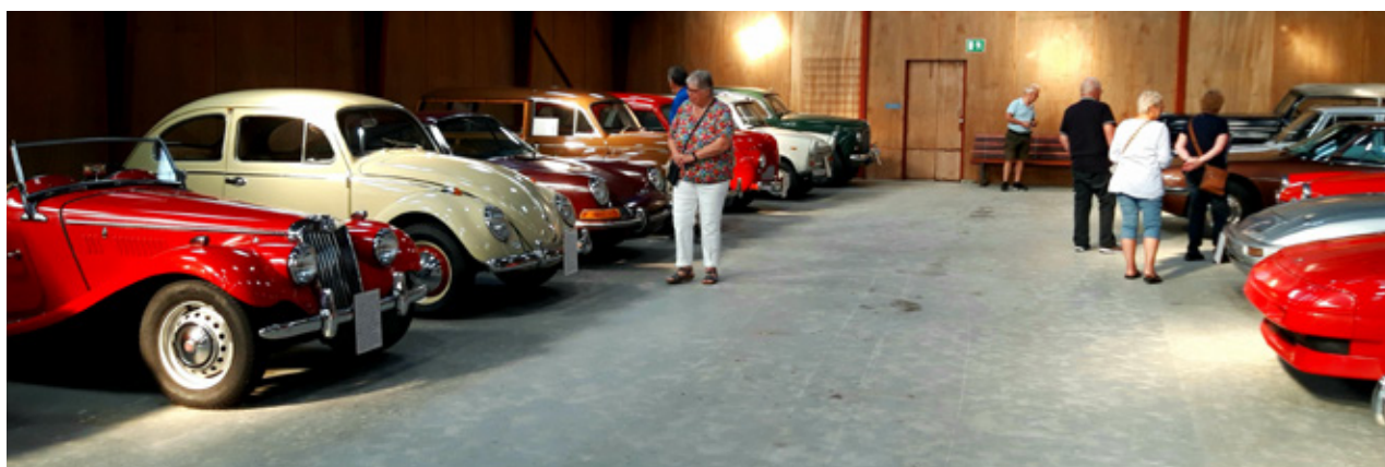
Der kigges på flotte biler på bilmuseet i Gjern.