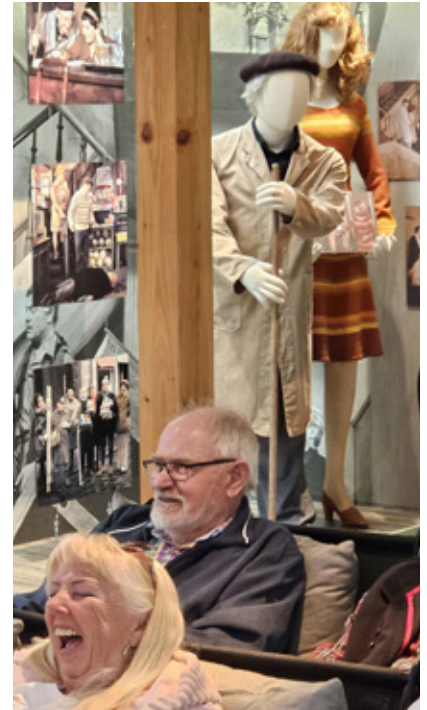
I udstillingen i baggrunden ses Meyer fra 'Huset på Christianshavn'.