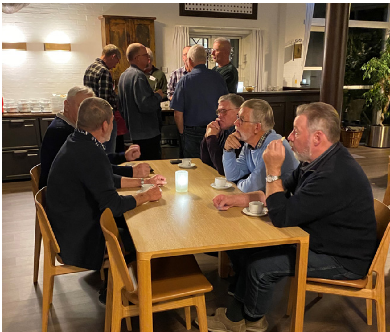
Kaffepause i Postillonon.