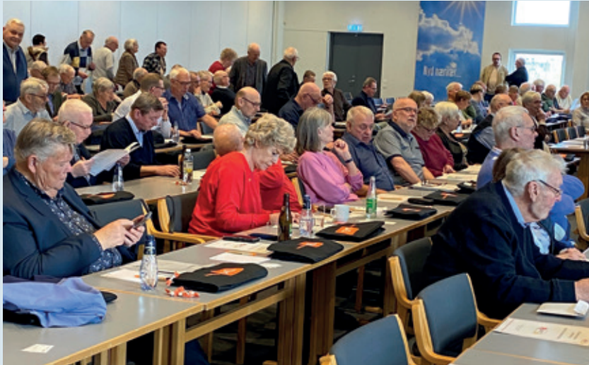
Medlemmerne venter på at generalforsamlingen går i gang.

Jeg vil lige berøre foreningens økonomi . Jeg kan sige, at vi prøvede at spare det vi kunne i 2022. Vi budgetterede med et underskud på 93.000 kr. men af to væsentlige årsager, så endte det med, at vi kun fik et underskud på 10.000 kr. EU-turen blev noget billigere end vi havde budgetteret og fra Biblioteksstyrelsen fik vi et større tilskud, end vi havde regnet med.