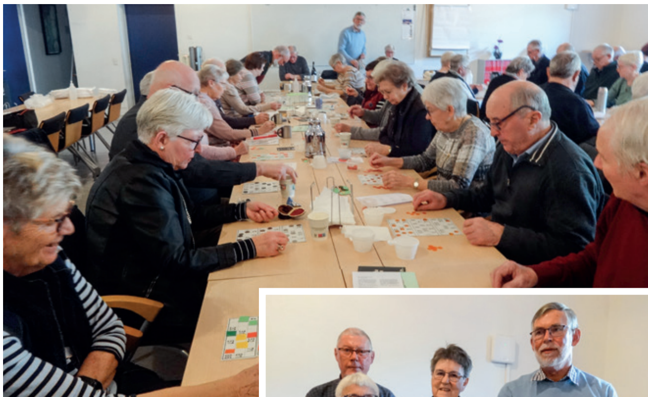
Der spilles banko efter generalforsamlingen.