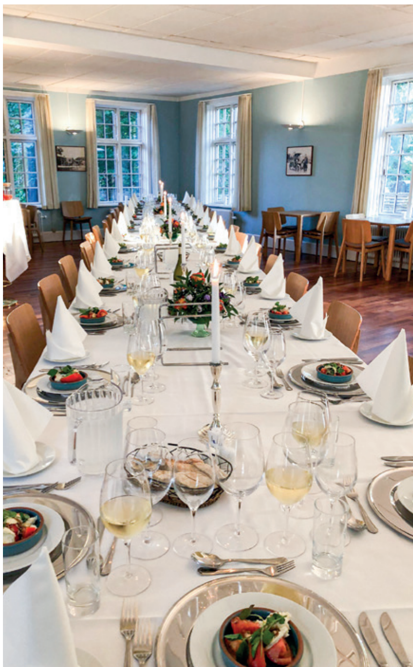
Bordet er dækket til festmiddagen.

Vi skal have din tilmelding senest mandag den 3. juli 2023. Der vil umiddelbart derefter og senest den. 14. juli blive udsendt information til alle ansøgere, uanset man er blevet optaget på kurset eller ej.