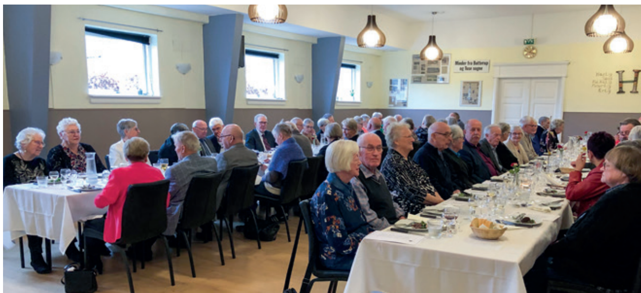
▼ De festglade jubilæumsgæster.