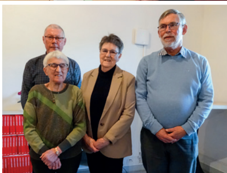
► Den nye bestyrelse i Pensionistforeningen "Posten" Vejle.