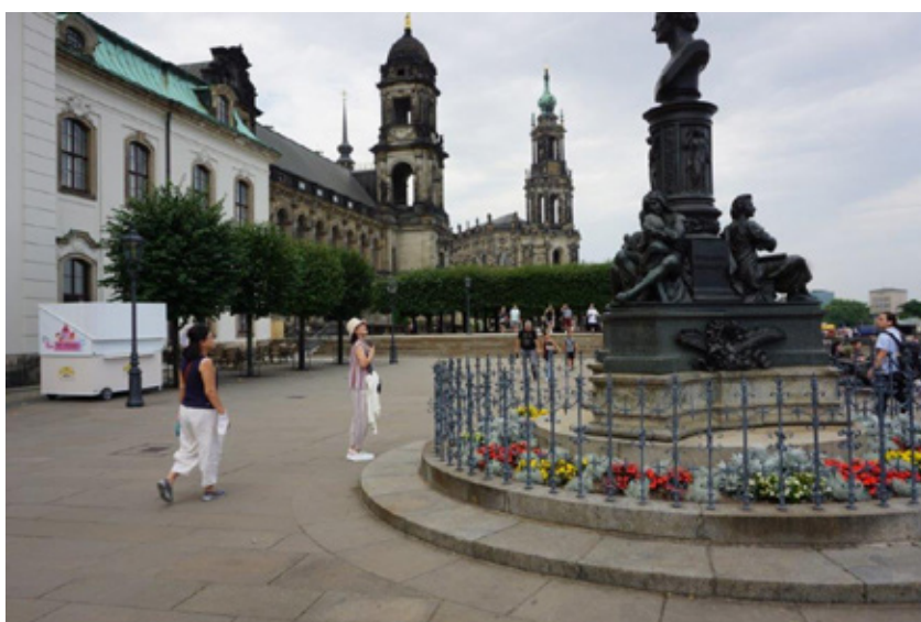
Fra det korte besøg i Dresden.