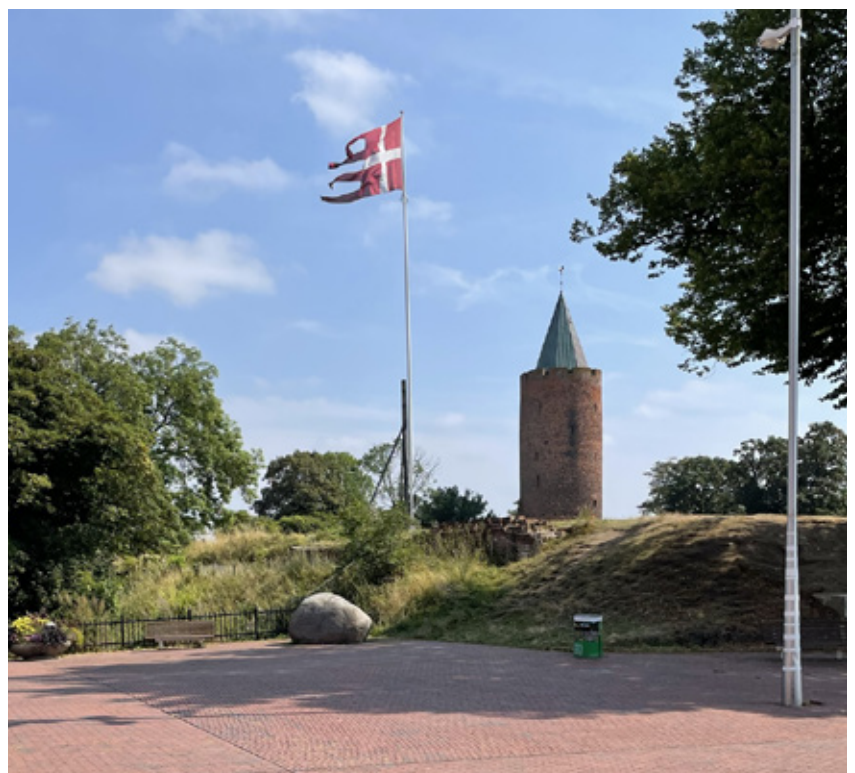
Gåsetårnet i Vordingborg.