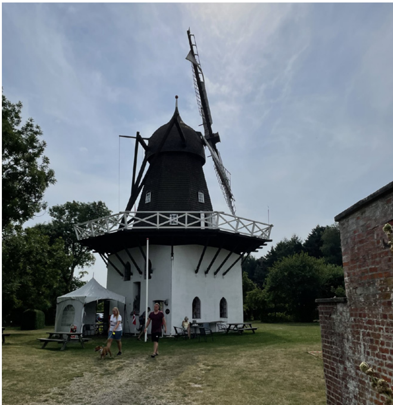
Møllen på Fejø.

Vi kørte videre mod Nyborg, hvor yderligere et par skulle med på turen. Derefter kørte vi mod Svendborg og Tåsinge. Chaufføren stoppede ved Landet Kirke, hvor vi så kirken samt hvor Elvira Madigan og Sixten Sparre ligger begravet. Undervejs kom vi forbi Valdemar Slot.