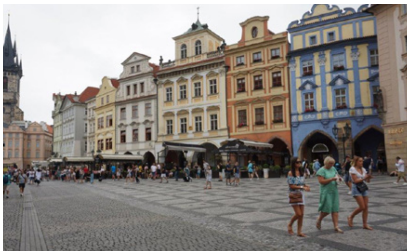
Prag er kendt for sine smukke bygninger.

veringer, som vist ikke i alle tilfælde kom fra de små håndskrevne lapper. Som fx myten om kejseren der fik et tegn fra himlen om, at han skulle dø ved foden af tårnet på St. Vitus, Prags smukke domkirke. Det var ikke just godt nyt for den magtfulde kejser, så han beordrede straks tårnet nedrevet. Sådant mistede St. Vitus sine oprindelige gotiske himmelstigende tårnspir. Kejsere døde naturligvis alligevel og heldigvis før hele tårnet var væk. Tårnet blev genopført i fuld højde, men nu med en mere ydmyg "kalot", som var den tidsaktuelle byggestil.