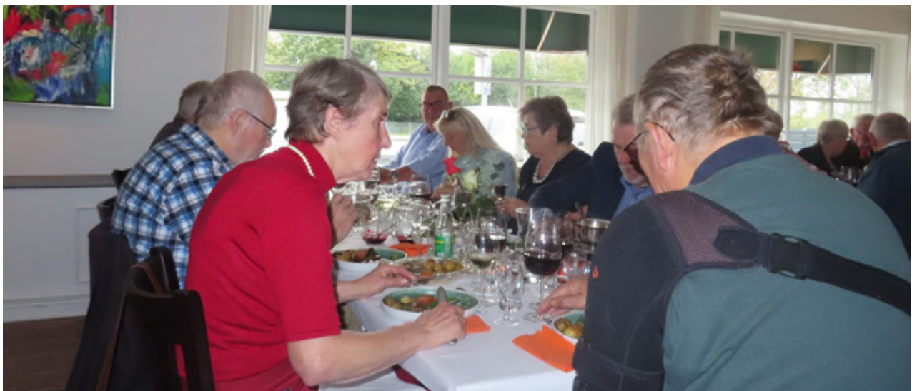
▼ Nogle af festens deltagere under middagen.