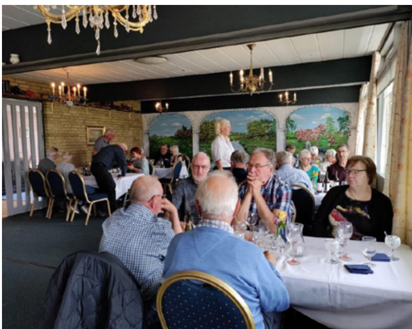
Deltagerne spiser middag på Bregninge Kro.