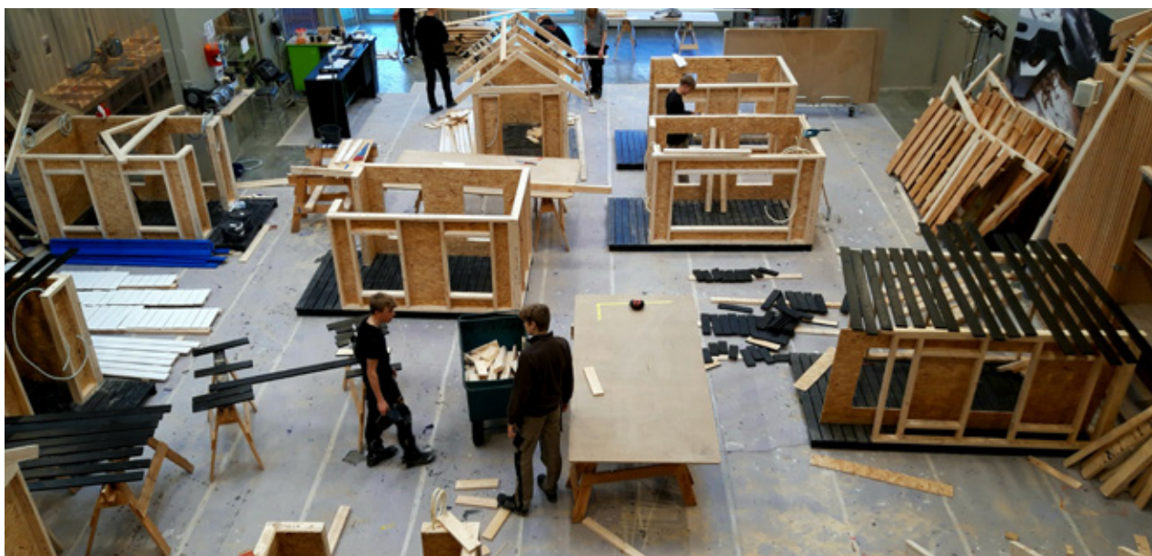
Eleverne på tømrerholdet er i gang.