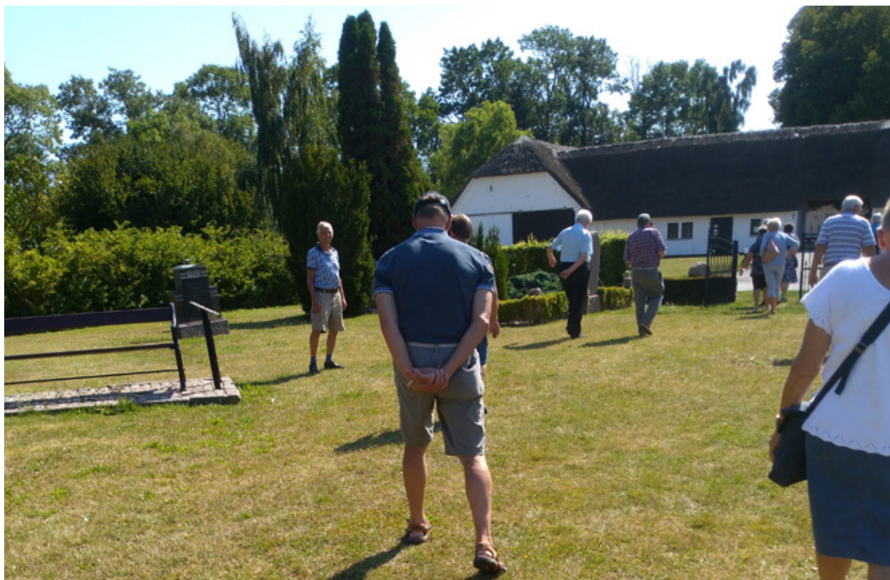
Rundvisning i Mindehaven.

Kilder: Hjemmesiden Kramnitze Pumpestation. / Pjecer fra de besøgte steder. / Dagbladsartikler.