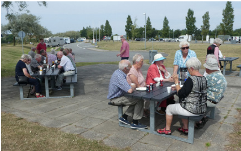
Tid til pause på en rasteplads.