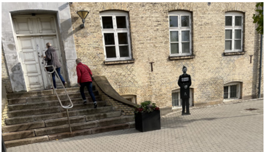
Indgang til Fængslet i Horsens.