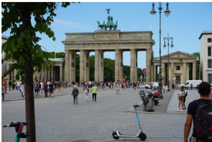
Brandenburger Tor i Berlin.