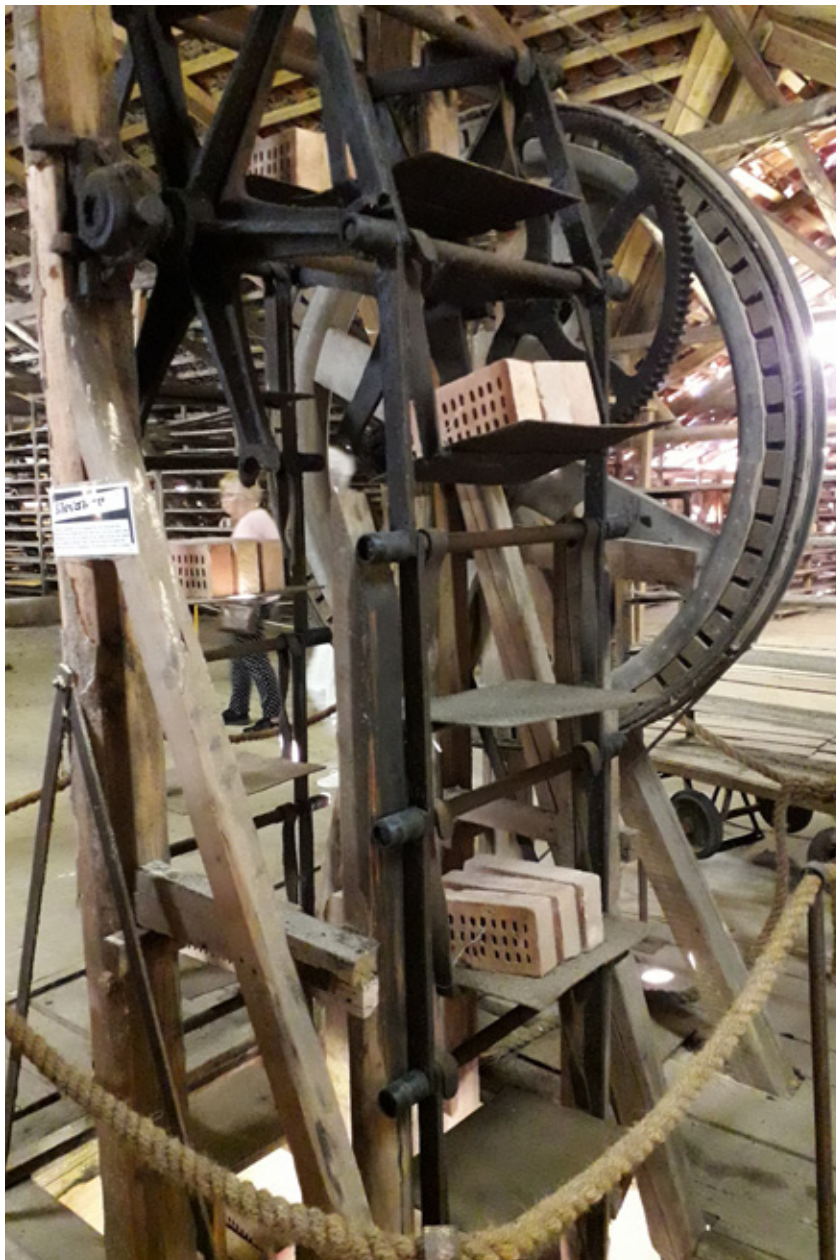
En af teglværkets maskiner.

Lilleskov Teglværk har en genbrugsbutik med møbler, der bliver eftersat og repareret af kompetente frivillige,