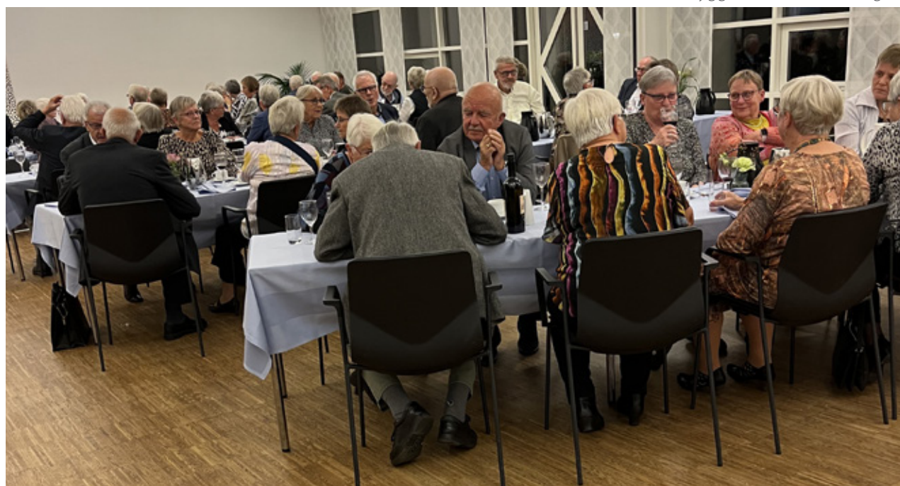
▼ Hyggesnak under middagen.