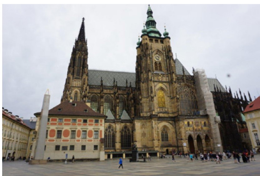
Sct. Vitus med kalotten.