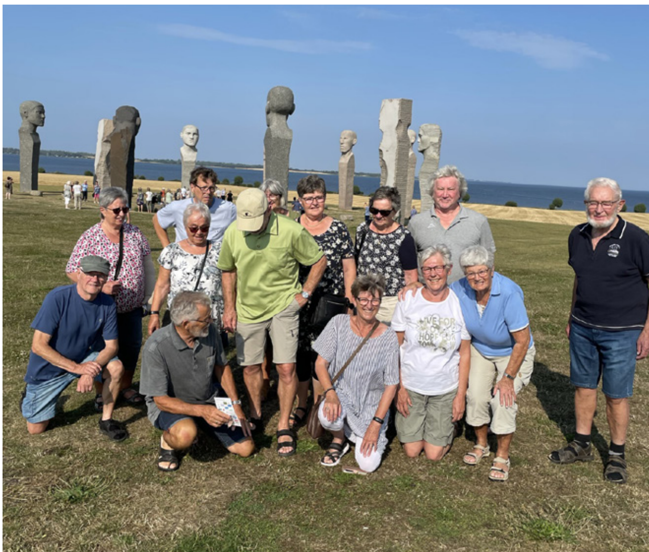
En del af deltagerne ved Dodekalitten.