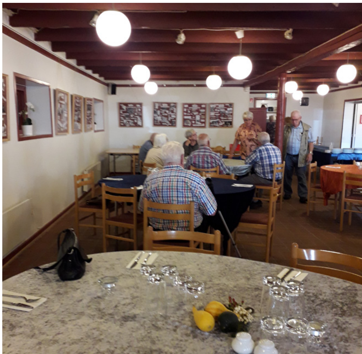
Cafebesøg på Tommerup Teglværks museum.