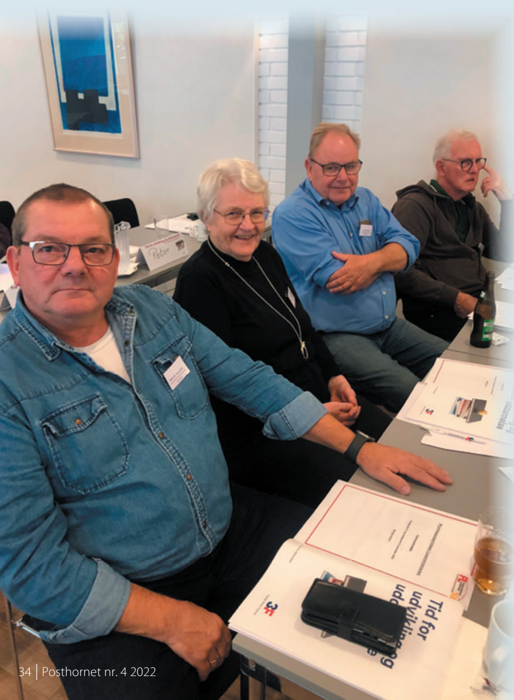
Deltagere ved formandsmødet.

Et af de andre spørgsmål gik på brugen af Faglige Seniorer. Rigtig mange af de fremmødte havde prøvet at søge en form for tilskud, og de fleste havde fået bevilliget et beløb. De klubber der ikke havde søgt, mente ikke, at de havde haft behovet.