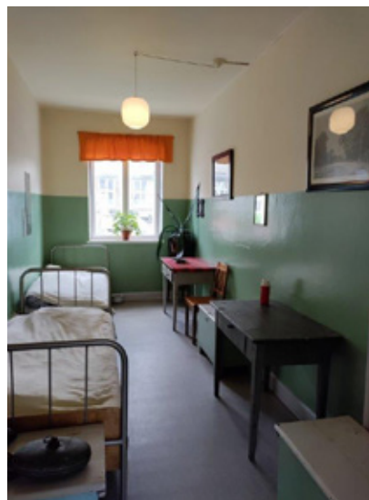
Et værelse på Forsorgsmuseet i Svendborg.