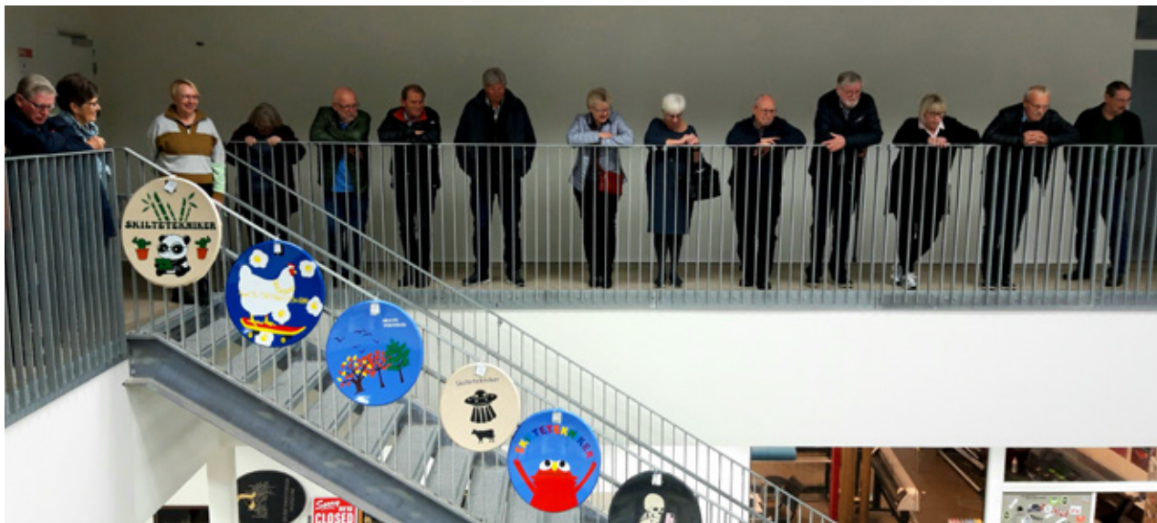
Rundvisning på skolen.