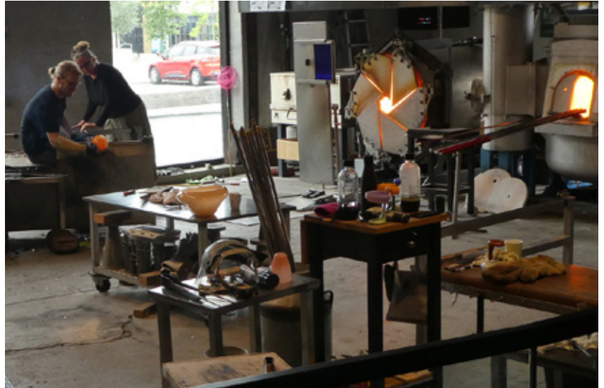
Der arbejdes på Holmegård Værk.

2. dag: Efter morgenmad kørte i vi til Rødbyhavn - hvor vi besøgte Femern Bælt udstillingen. Vi fik en rigtig god oplysende rundvisning om dette kæmpe projekt. Længden på tunnelen bliver 18 km. Tunnelen kommer til at rumme en tosporet motorvej i hver retning, samt to elektrificerede jernbanespor og får en gennemkørselstid på 7 og 10 minutter for hen-