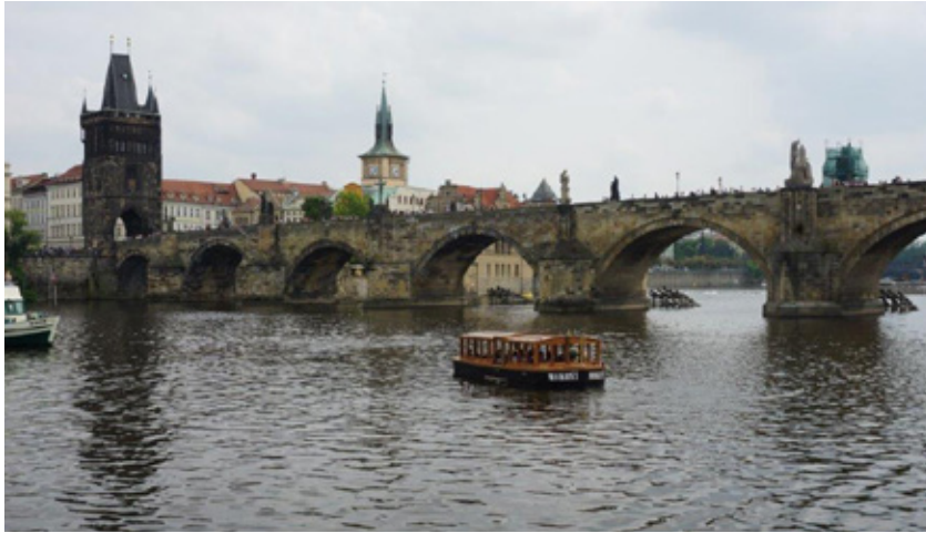
Karlsbroen. Prags historiske vartegn.

sad med min fadøl og tænkte, om dette tal mon inkluderede turisternes indtag, så jeg med min halve liter hjalp dem til at holde verdensrekorden. Nå, pyt, fadøllet var en fortjent velskænket nydelse.