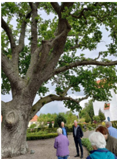
Landet Kirke på Tåsinge.