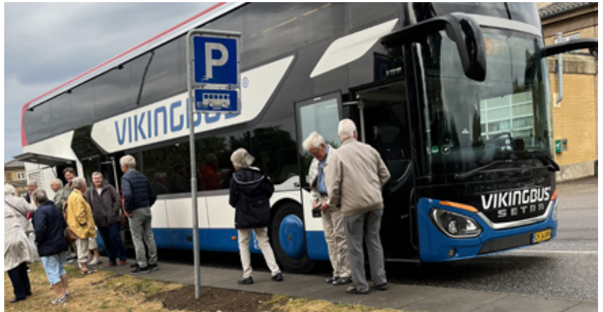
Deltagere på vej ud af bussen.

Kaffebord for deltagerne på NIOR bistro i Juelsminde.