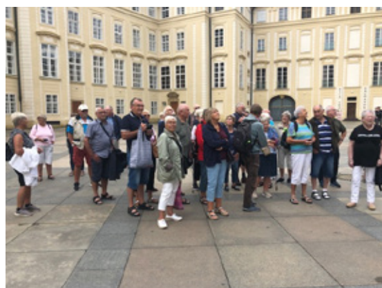
Næsten hele holdet er samlet.