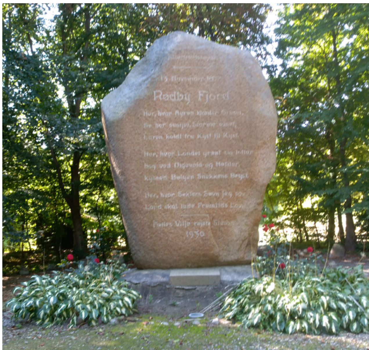
Glade jubilæumsgæster på Postgården.