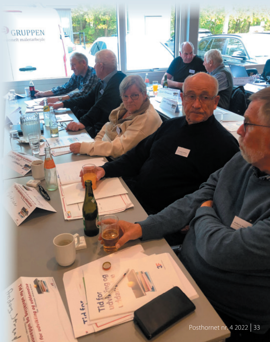
Deltagere ved formandsmødet.