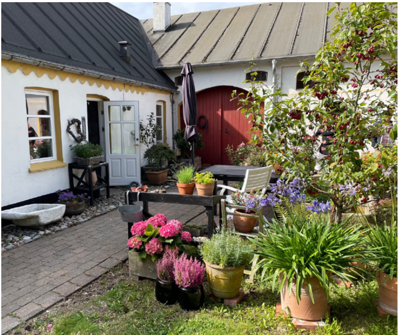
Indgang til Alderslyst vingård.

Da vi ankom, stod værtparret og tog imod os og bød på et glas køligt hvidvin samt en orientering om vingår-