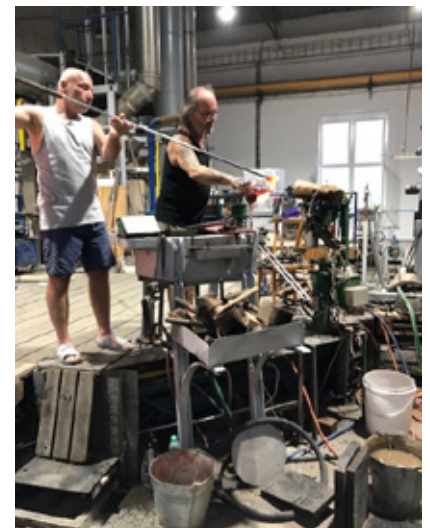
Fornemt glas bliver til i rå omgivelser.

Turens sidste destination, Berlin, er Tysklands hovedstad og det lader sig ikke skjule. Store moderne bygninger præger billedet i den kæmpestore by. Vores hotel, 'Park Inn by Radisson Berlin Alexanderplatz' med sine 37 etager og beliggenhed lod intet tilbage at ønske i den sammenhæng. Jeg hørte da også en på holdet nævne, at hun følte sin jordforbindelse truet på etage 32.