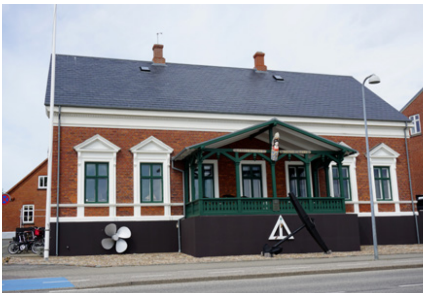
Fanø Skibsfart og Dragt museum.

Vi ankommer til Sønderho Kirke – en anderledes og utraditionel kirkebygning fra 1782. Det er en stor kirke med plads til 600 personer. I den ene side af kirken er der plads til kirkegængere uden dragter, det er de fattigste, hvor kun hovederne er synlige for de øvrige kirkegængere. Bænkene i kirken kommer fra Ribe domkirke. I loftet er der ophængt 15 kirkeskibe, der er lavet af søfolk på langfart og senere foræret til kirken i taknemmelighed over, at de er kommet uskadt tilbage. Der er også ophængt et krigsskib, der er strandet på Fanø med beskeden om, at den skal ophænges i kirken. Fanø har to kirker og to præster. Kirkegården er meget speciel med græs overalt. Ved gravstenene er der kun plads til lidt beplantning.