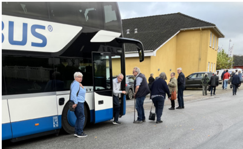
Klar til frokost.

Efter vi havde handlet, gik turen videre til dagens højdepunkt, nemlig julefrokosten på Østerhøjst Kro. Kroen er virkelig værd at gæste, da maden er helt i top, og servicen er fin. Efter vi havde fået kaffe, kørte vi hjemad igen.