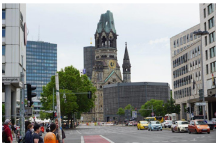
Gedächtniskirche i kontrast til byens moderne byggeri.