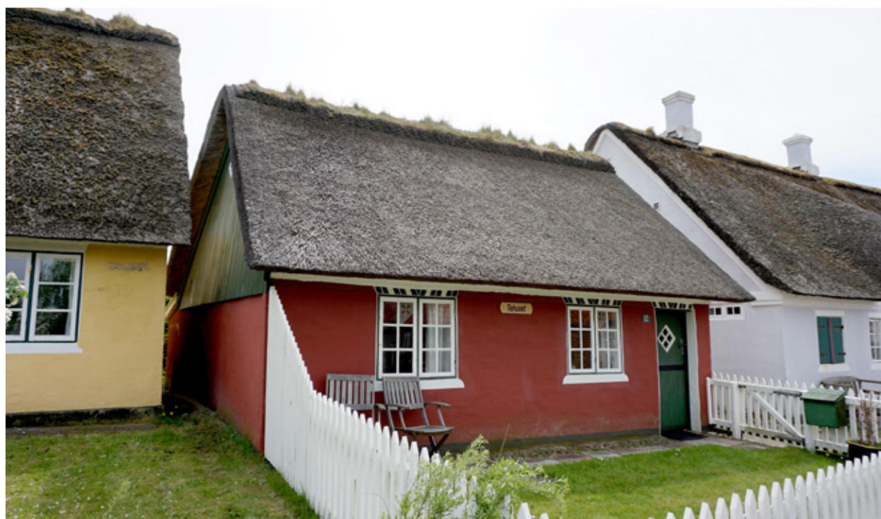
Byhus fra Sønderho.