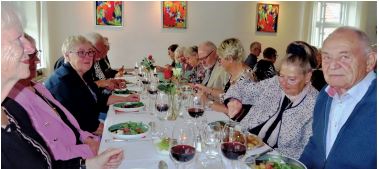
▲ Tid til hyggesnak under middagen.