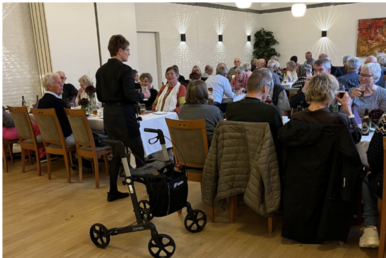
Frokost på Østerhøjst Kro.