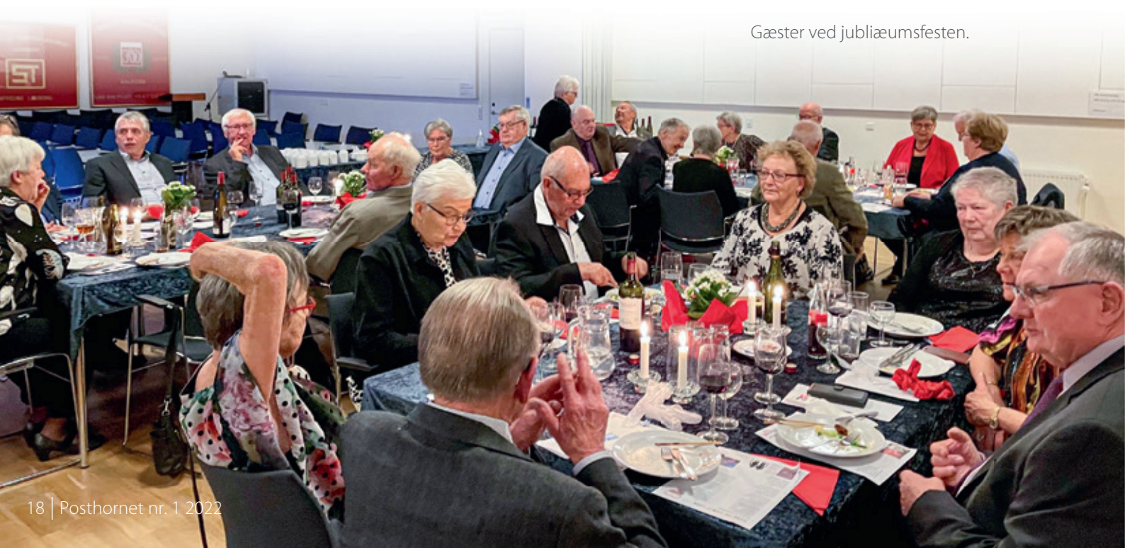
Gæster ved jubilæumsfesten.