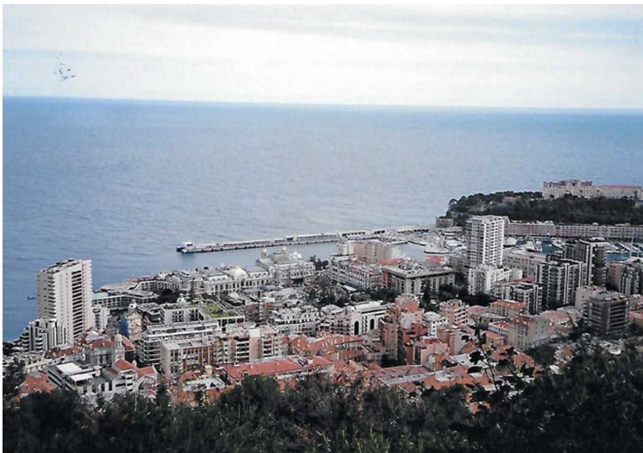
Udsigt over Monaco.

er der fredeligt i området, og vi kørte videre nordpå langs Donau. Fin overnatning og excellent middag til ingen penge i Dunaujvarus. Sprang med vilje Budapest over (store byer er ikke for bilturister). Til gengæld tog vi en afstikker til den smukke Balantonsø, hvor mange danskere har camperet i årenes løb. Ved Donau-knækket nord for Budapest handlede vi i den skønne by Szentendre og fandt overnatning i Esztergom.