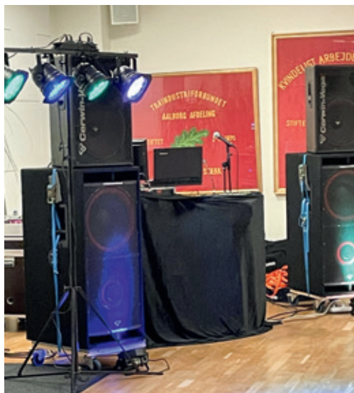
Discjockeyen er klar til dans.