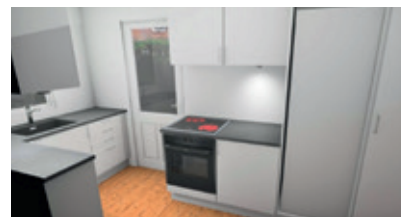
Nyt køkken på Langeland.

Der bliver anlagt nyt klikgulv i stue og i køkken. Stue og køkken bliver malet således, at der er lyst og venligt.