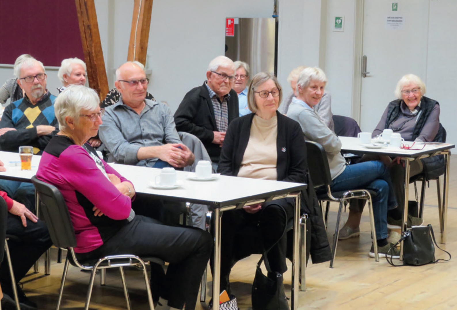
Deltagere fra Odense Postpensionister.