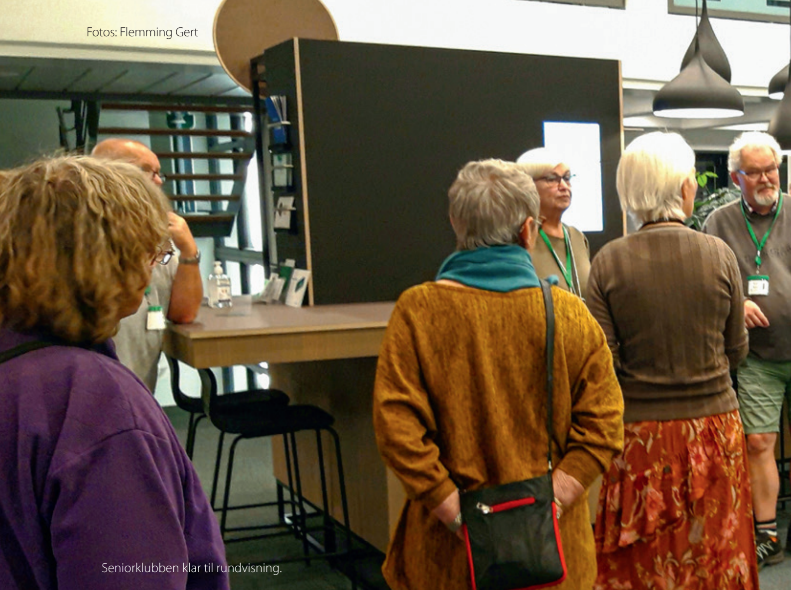
Seniorklubben klar til rundvisning.