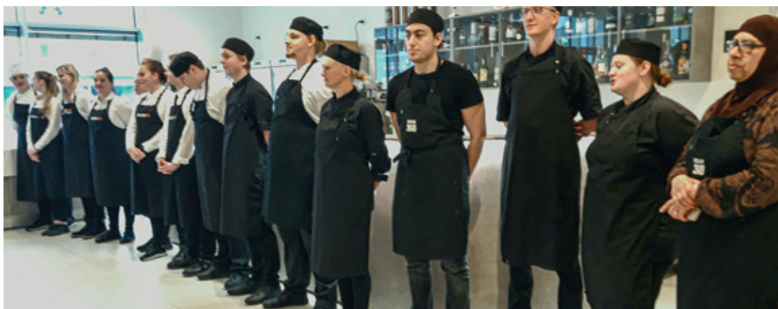
Eleverne på kokkeholdet.