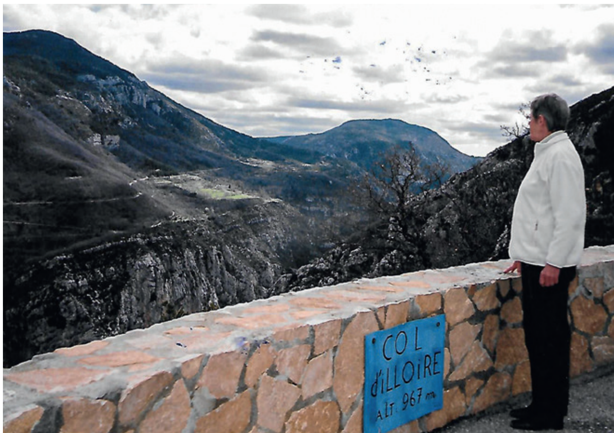
Gorges du Verdon. Frankrigs svar på Grand Canyon.

så en overnatning i en lille by Andora ved den italienske Riviera. Både hotel og aftenmenu var dyr i forhold til både Spanien og Frankrig. Og om morgenen ved udkørslen fra garagen lavede jeg en grim ridse i siden af bilen. Jeg var oppe i det røde felt, men fruene sagde stilfærdigt, at det jo ikke drejede sig om liv og død. Og så gik det hu-hej hurtigt gennem Italien til