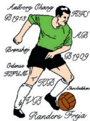
Navne på danske fodboldklubber.

Da jeg var ung var der ingen penge i fodbold alle var amatører