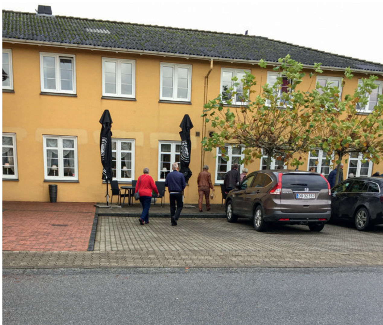
Øster Højst Kro.