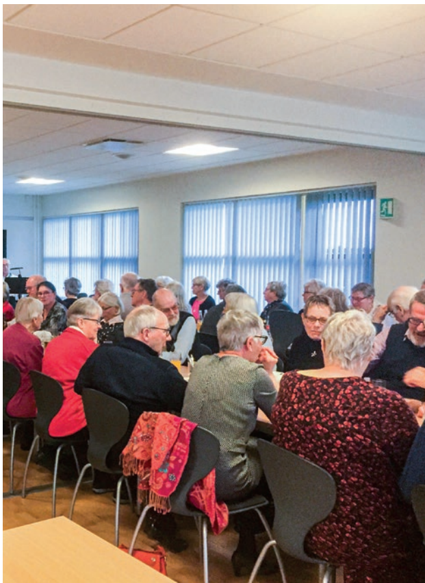
Sammenkomst i Fredericia klubben

Kl. 16.30 sluttede vi efter en hyggelig og spændende bankodag.