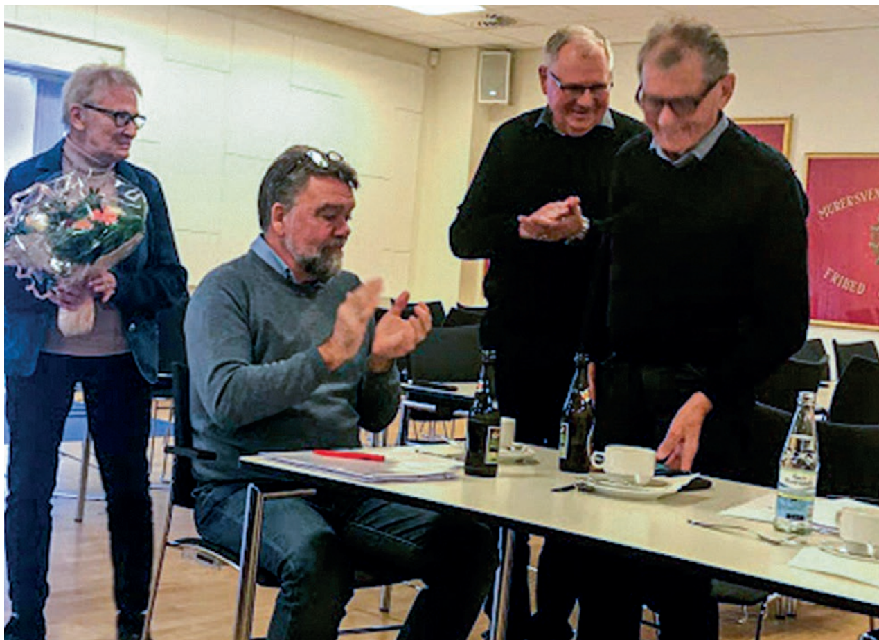
Bent (til højre) stopper som bestyrelsesmedlem efter 20 år i Aalborg klubben.

Han er en mand med stor bestyrelseserfaring, det har vi haft meget glæde af, bl.a. når der skulle arrangeres ture, udflugter og tilrettelægges samt få gode tilbud hjem. De mange udlandsrejser med tilrettelæggelse og som rejseleder har været et kæmpe arbejde, som er kommet vores medlemmer til gode og sparet mange penge.