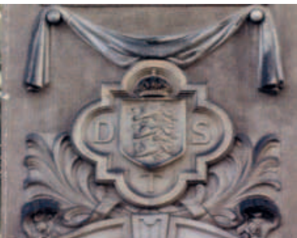
Ingangsparti til Post- & Tele Museum. (DST - Den Danske Statstelegraf)