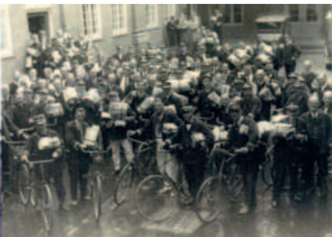
Brevbærere i gården o. 1930