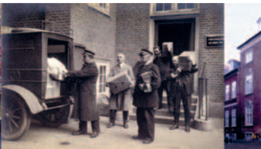
Indlæsning af afgående pakkepost o. 1920