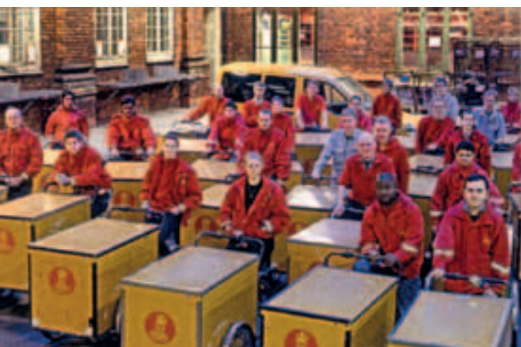
Postbude med Christianicykler 2008

Telegrafpersonalet skulle sørge for, at forbindelserne til forskellige steder i Danmark og til udlandet fungerede,