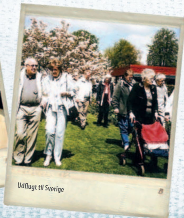
Udflugt til Sverige

Her havde vi demonstration af magneternes gavnlige virkning. Der var lejlighed til at prøve puder og tæpper med indbyggede magneter, det var der en del, der benyttede sig af. Herefter var der kaffe og kage. I april måned har vi i tidligere år været på firmabesøg, bl.a. Politistationen, Falck, vi har bowlet, besøgt dagbladet, vi har været på Dyssegårdsvej for at se omdelingscenteret, historiens hus og meget mere.