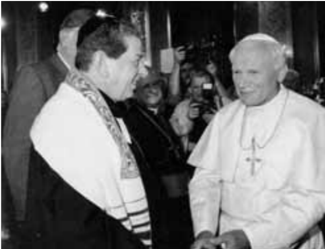
Venskabelig samtale under pave Johannes Paul IIs besøg i København