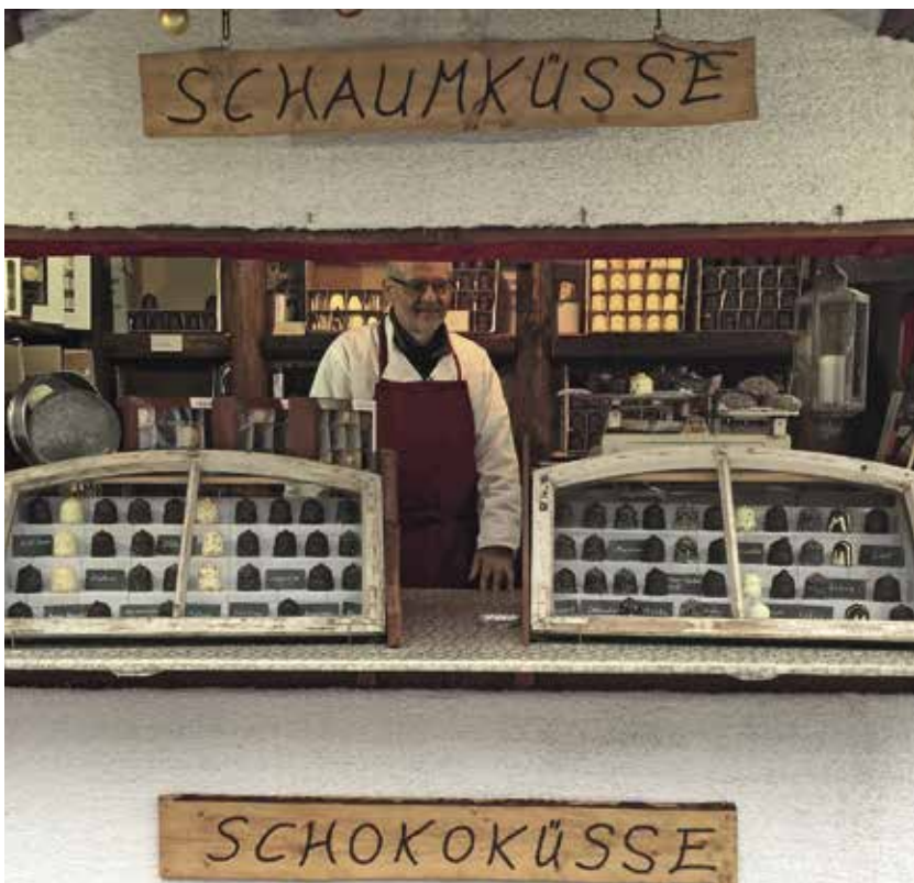
En flødebolle bod