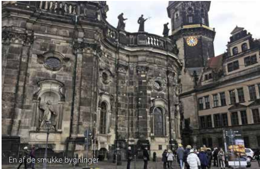
En af de smukke bygninger