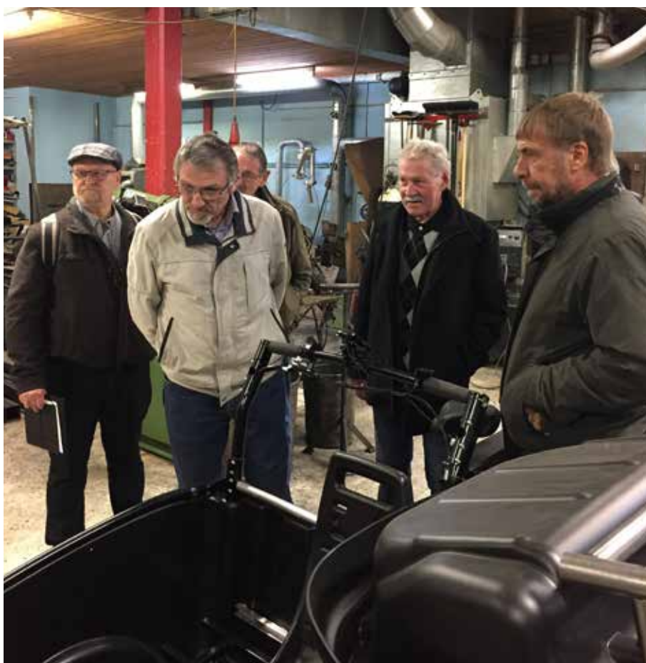
Rundvisning hos Winther.