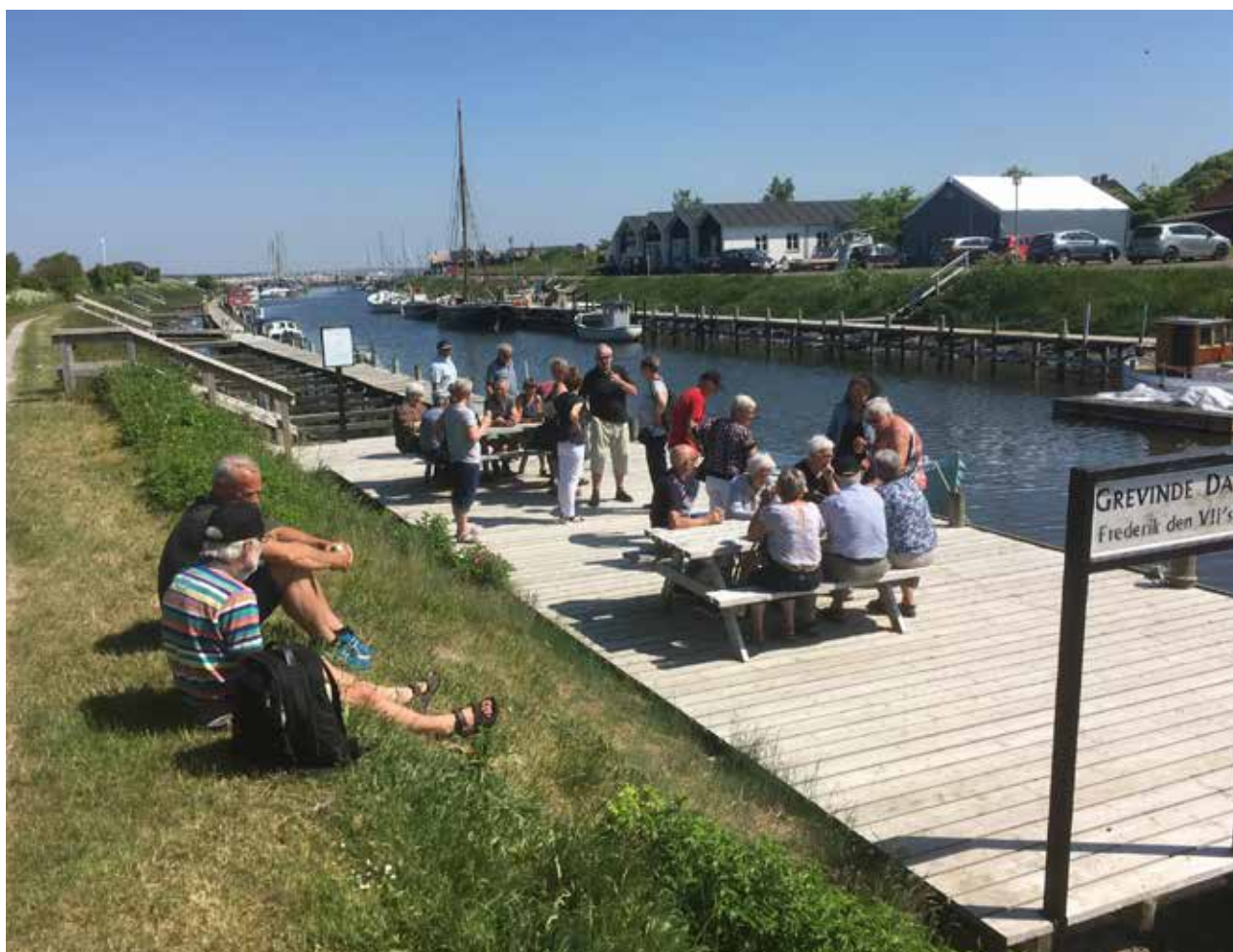
Hygge ved Frederik den VII's kanal efter en succesrig tur.

Dagen sluttede hen på eftermiddagen, og det var glade deltagere, der tog hjem.