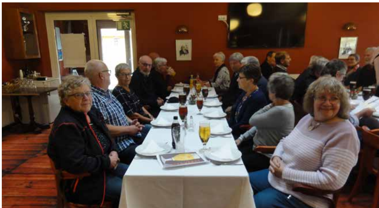
Vi venter på wienerschnitzel.