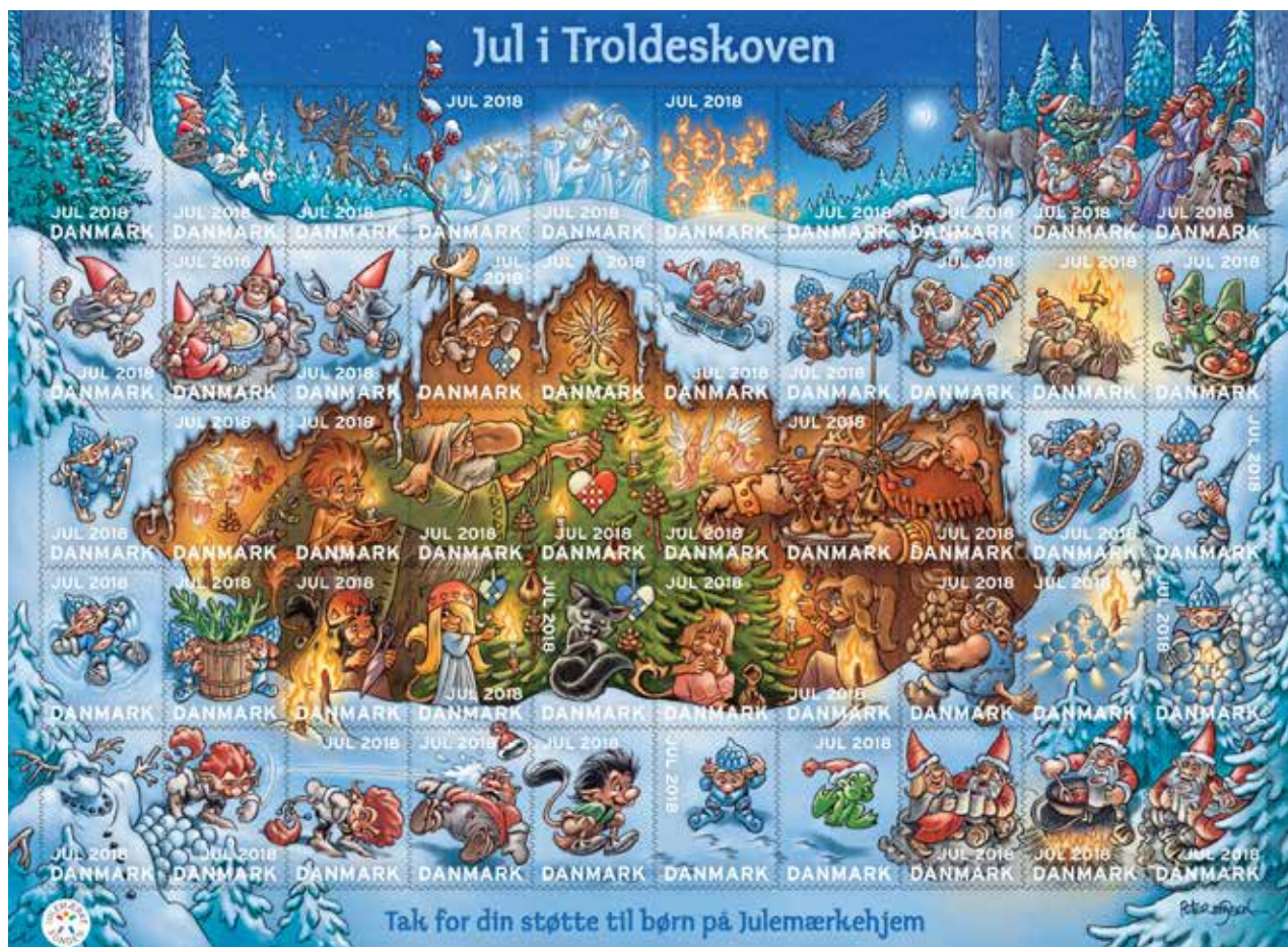
Jul i Troldeskoven er navnet på årets Julemærke, som er tegnet af Peter Madsen.

-Hvert år mærker vi et fald i antallet af solgte Julemærker, og vi kan ikke som tidligere alene drive Julemærkehjemmene ved at sælge støttemærket til juleposten. Dertil er den analoge verden blevet overhalet. Men vi henter alligevel knap en femtedel af vores samlede indtægter alene på Julemærkesalg i november og december, så indtægterne er stadig vigtige for os. Vi håber, at danskerne stadig støtter op om den danske juletradition, som Julemærket er, og måske pynter med det på pakker, bordkort og gavemærker som alternativ til juleposten, slutter Søren Ravn Jensen.