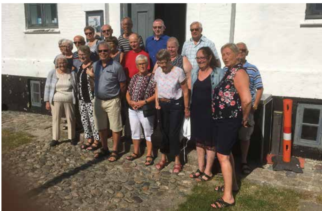
Nibes Postpensionister samlet ved museum i Løgstør ved Frederik den VII's kanal.