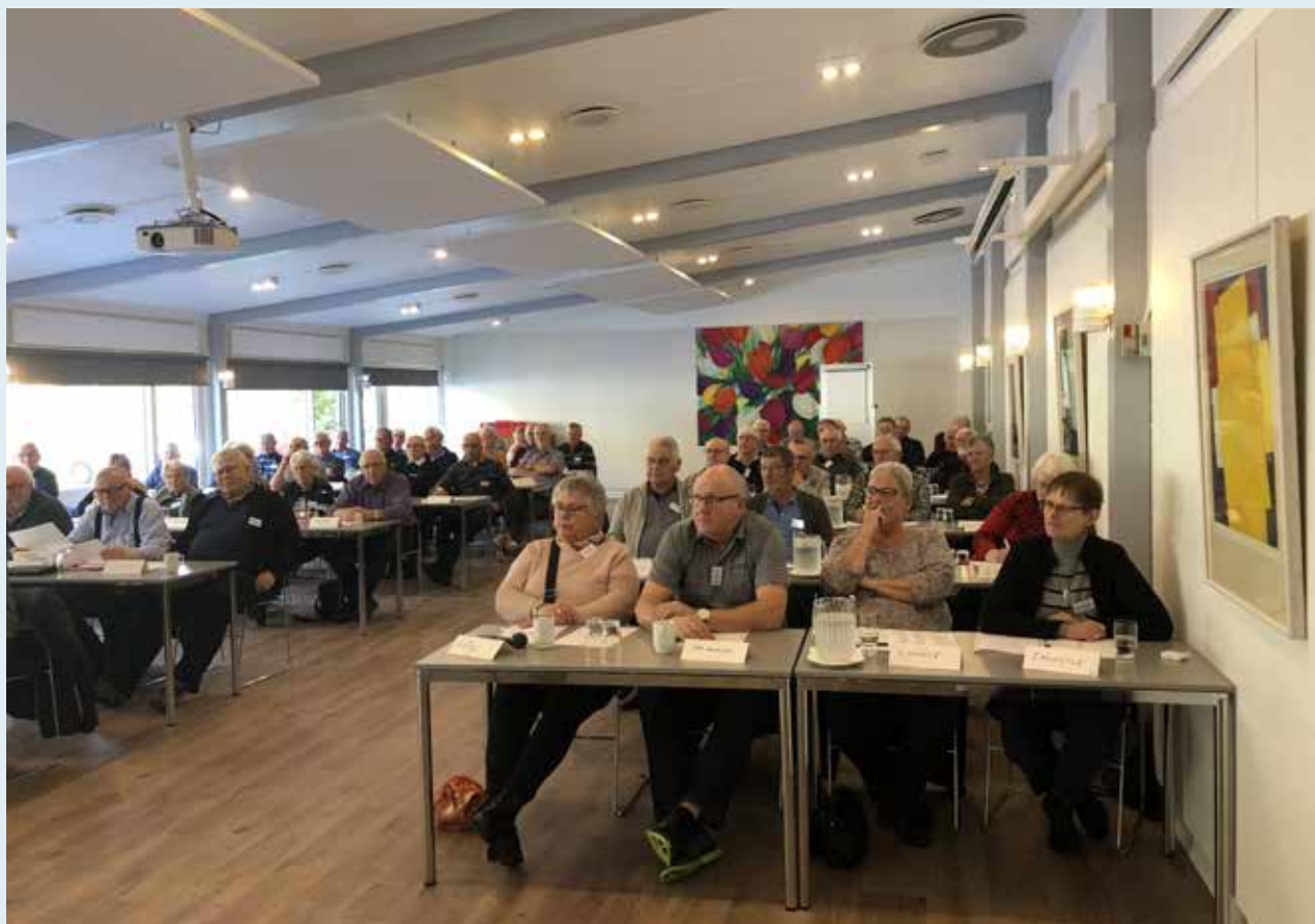
Der lyttes koncentreret.

OAo, og derfor at vores medlemskontingent er nøjagtig ligesom en fagforenings – og derfor fradragsberettiget. Vi har ikke hørt noget siden denne dokumentation er indsendt. Vi forventer at sagen dermed er afgjort.