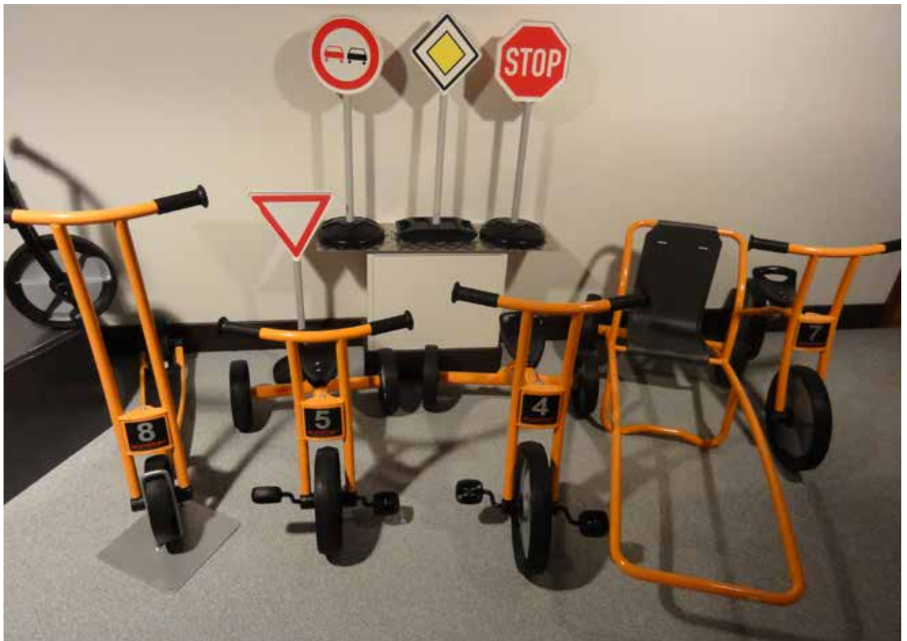
Et lille udpluk af cykler.

Derefter blev vi delt i 2 grupper med hver sin rundviser og fik en rigtig flot rundvisning på hele fabrikken. Vi fik forklaret, hvordan man bukker, svejser og maler rør, og