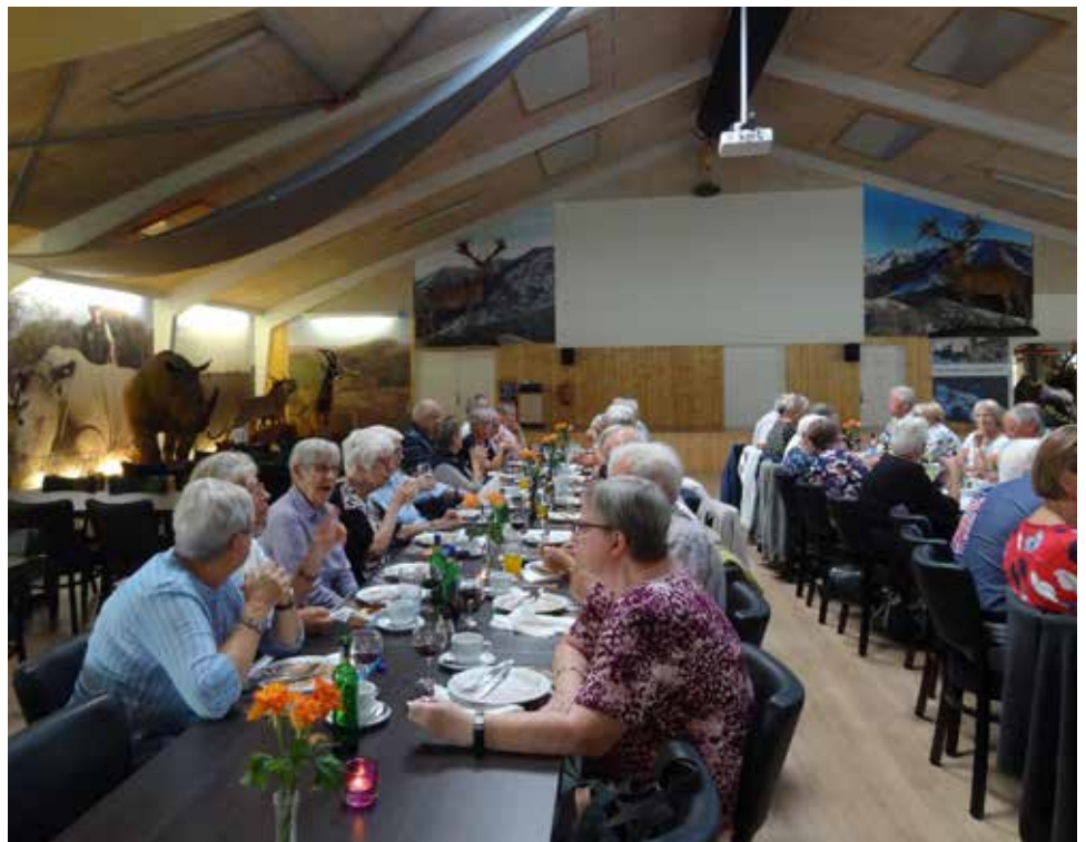
Middag hos Nygaard.

Onsdag den 5. september Kl. 09.00 var der afgang fra Fredericia banegård til Nygaards Afrika, Nr. Lydumvej 110, 6830 Nr. Nebel, med 48 deltagere. Da vi først skulle være der kl. 11.00, var der god tid, så vi kørte over Vorbasse – Hovborg og ad de små veje derover.