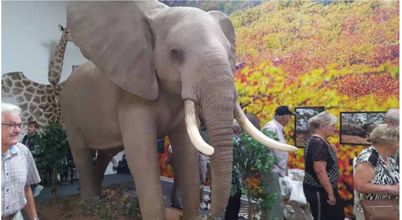
En af "The big five".

Postvæsenets Pensionistforening Fredericia