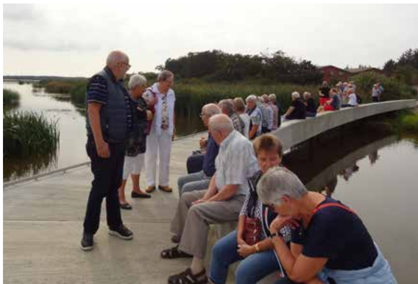
Lige en velfortjent pause.