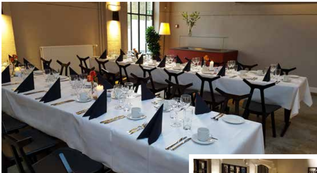
Smukt dækkede borde på Oven Vande.