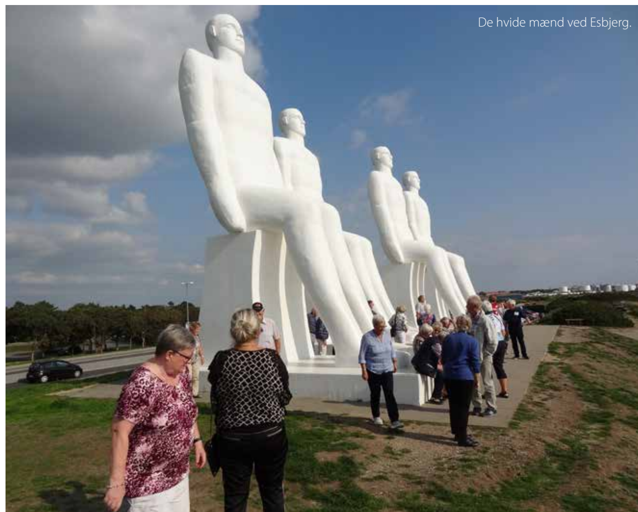
De hvide mænd ved Esbjerg.