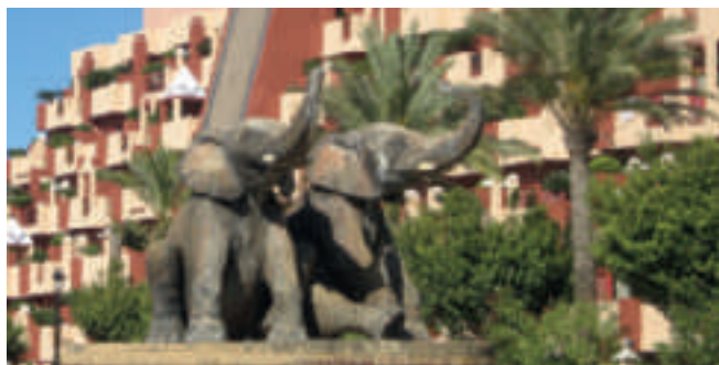
En af områdets flotte rundkørsler

Hvor skal ferieturen gå hen i år? Et spørgsmål, som bestyrelsen drøfter hvert år – i år måske lidt mere intens, da der denne gang – for første gang i forenings historie – var forslag om, at ferieturen skulle foregå med fly. Bestyrelsen enedes om at henvende sig til Gislev Rejser for at få selskabet til at arrangere en 8 dages tur til Malaga i Spanien. Programmet for turen blev godkendt, og 49 postpensionister kunne se frem til at komme med – ret hurtigt blev turen fuldttegnet. Planen var, at vi skulle flyve fra Billund, men på grund af Cimber-Sterlings konkurs måtte vi i stedet flyve fra Kastrup med Norwegian. Gislev Rejser sørgede – uden ekstraudgift for deltagerne – for bustransport til og fra Kastrup, samt at en rejseleder ville hjælpe til med indtjekningen. Ligeledes ville der stå en rejseleder klar til at tage imod os i Malaga Lufthavn.