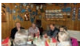
Stegt flæsk på Truust kro