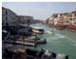
Hovedgaden i Venedig

Næste dag var vi på et vinslot med rundvisning og sluttede af med italiensk frokost og vinsmagning – en fin tur, næste dag sejlede vi over lagunen til Venedig og fik en rundvisning af en lokal dansk guide – rigtig god dag. Verona er en flot og hyggelig by – den sidste dag dernede var vi på marked i gamle Jesolo, og så var de 5 dage ved Lidoen lige pludselig forbi, og turen gik hjemad gennem Østrig og Tyskland med overnatning i en lille by i Midtjylland. Vi var hjemme i Silkeborg søndag aften kl. 21.30 – trætte men en god oplevelse rigere.