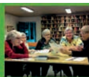
Gruppearbejde i biblioteket