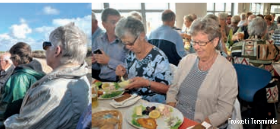
Frokost i Torsminde

en god festmiddag og bagefter gik vi i kælderen til en hyggelig 3. halvleg.