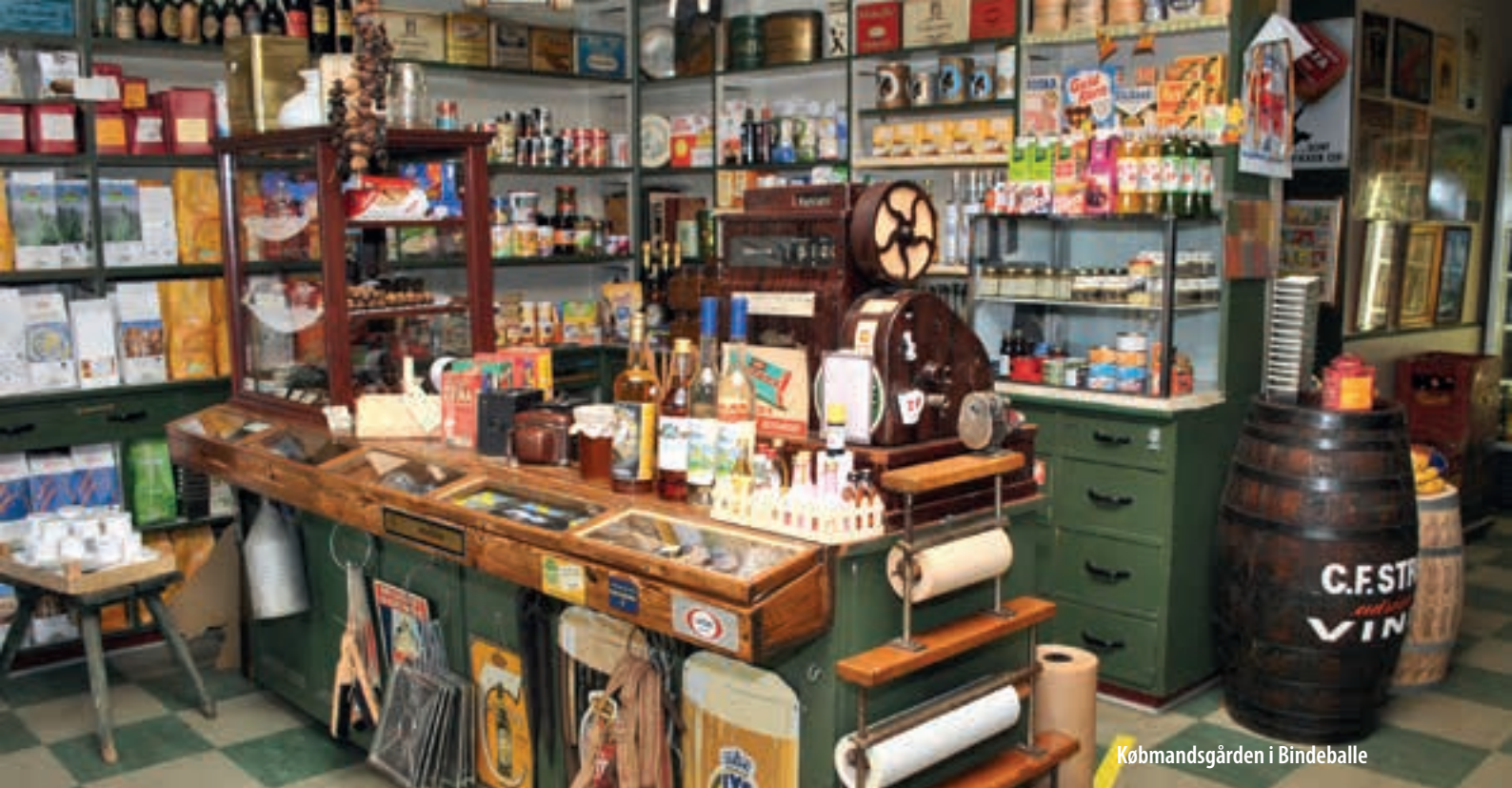
Købmandsgården i Bindeballe