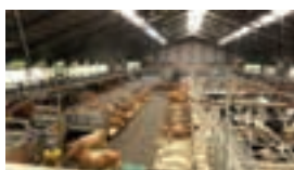
Køerne i Forsøgscenter Foulum