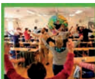
Gymnastik i Brochsgaarden