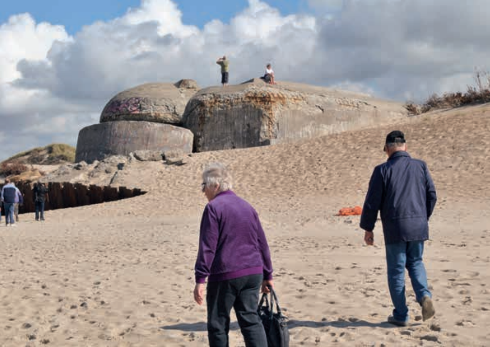
Bunkers ved Hovvig