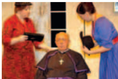
Billeder fra "Den nøgne sandhed"