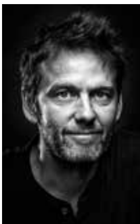
Foto, Carl Quist-Møller Carl Quist-Møller er kunstneren bag årets Julemærke. Han har tegnet børnene på Julemærkehjem, og det er der kommet 50 Julemærker ud af.