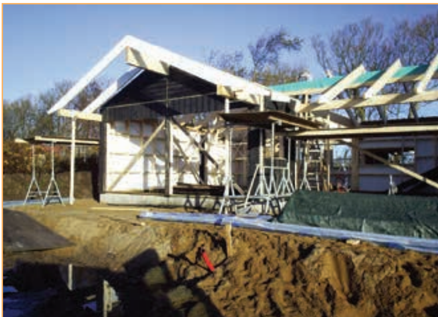
Det nye hus i Skyum bliver på 98 m2 plus 15 m2 overdækket terrasse, samt stor træterrasse.

Endelig er der ny dør til badeværelset, som er monteret modsat