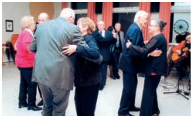
Og dansen den går