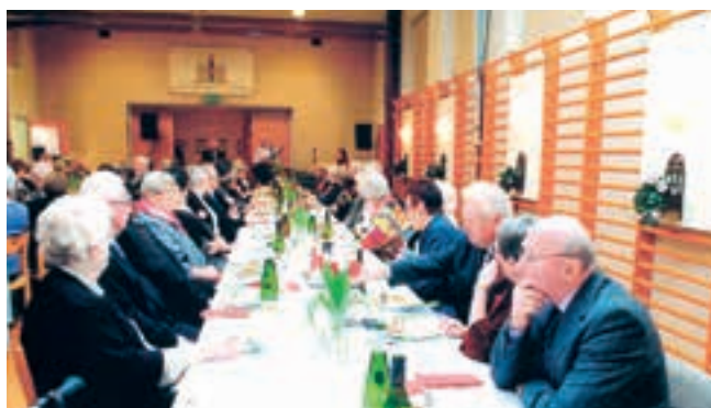
Samtlige deltagere hyggede sig hele aftenen

Til lejligheden var der forfattet et par sange, som alle med glæde sang med på.