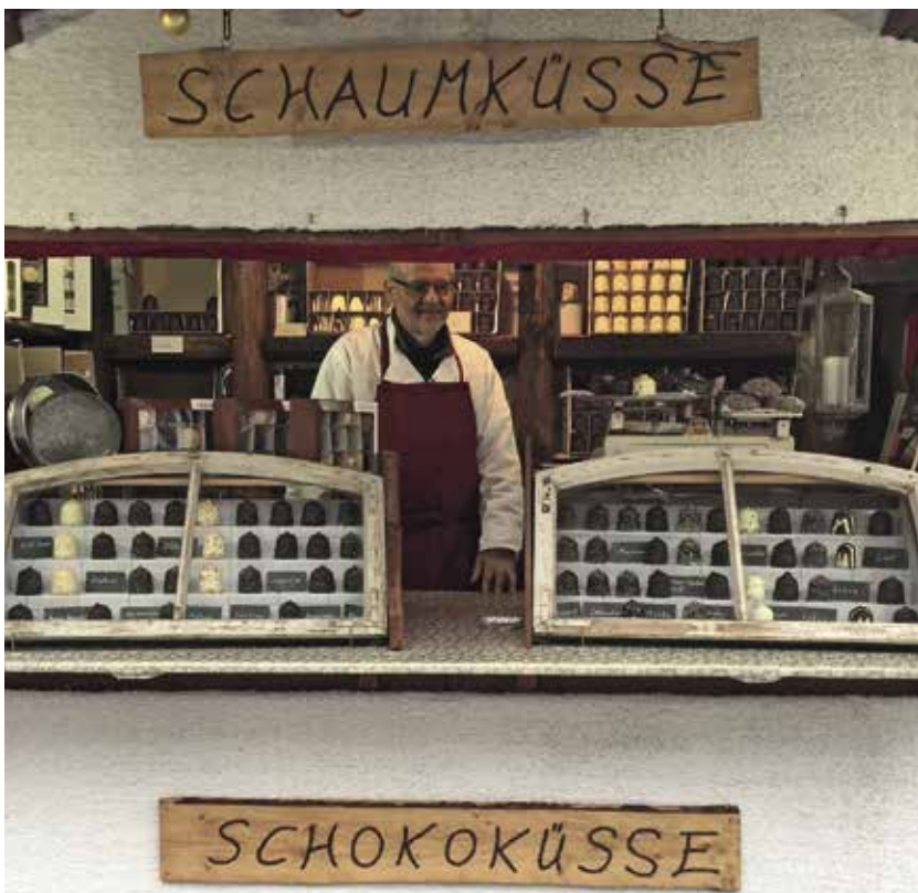
En flødebolle bod