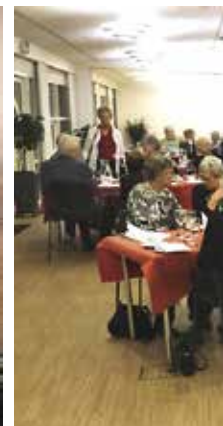
Deltagere i general