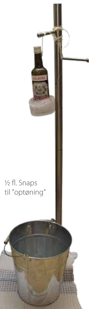
½ fl. Snaps til "optøning"