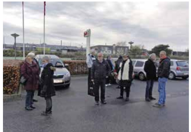
Vi mødes på P-pladsen