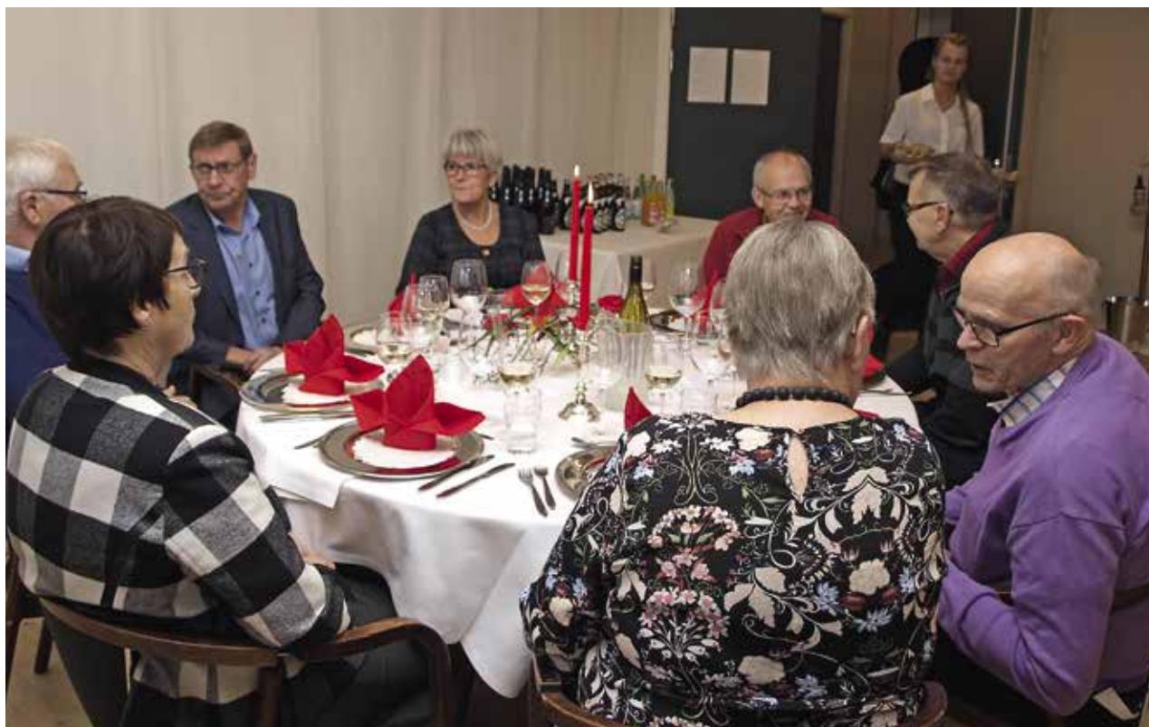
Gæster fra jubilæumsfesten

garn, som er et kæmpeproblem i alle europæiske havne. De brugte garn bliver skilt ad, renses og gennemgår en lang proces, hvor de bliver omdannet til plast granulat, som bruges i plastindustrien. Diverse metaller bliver ligeledes frasorteret og solgt. Virksomheden er fortsat under udvikling.