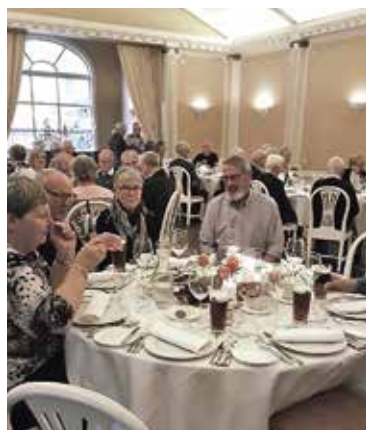
Julefrokost på Knapp