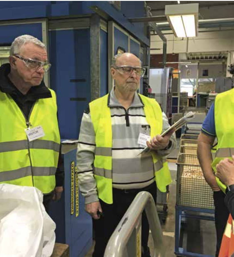
Under rundvisningen i de gule veste.

Den 21. november kl. 9.00 mødte 17 personer op på p-pladsen uden for Danfoss fabrikken i Hårup.