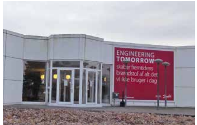
Danfoss i Silkeborg