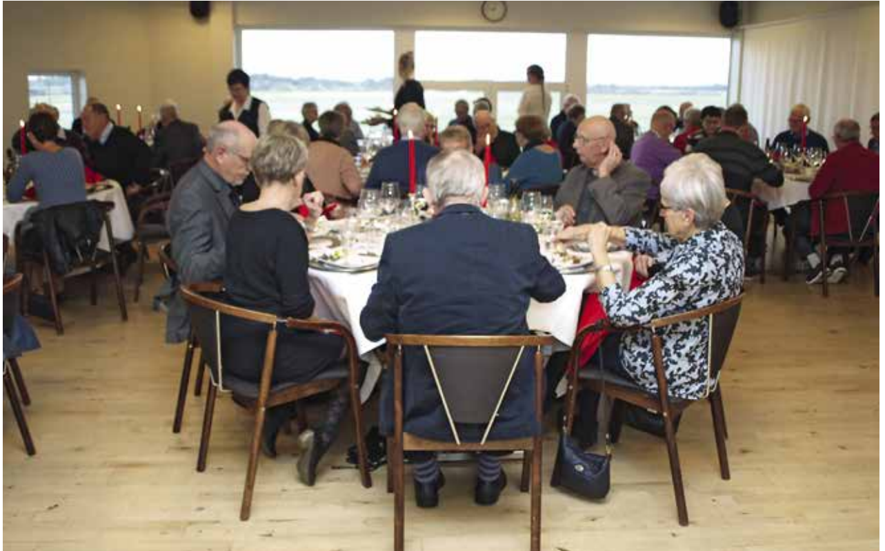
Gæster fra jubilæumsfesten