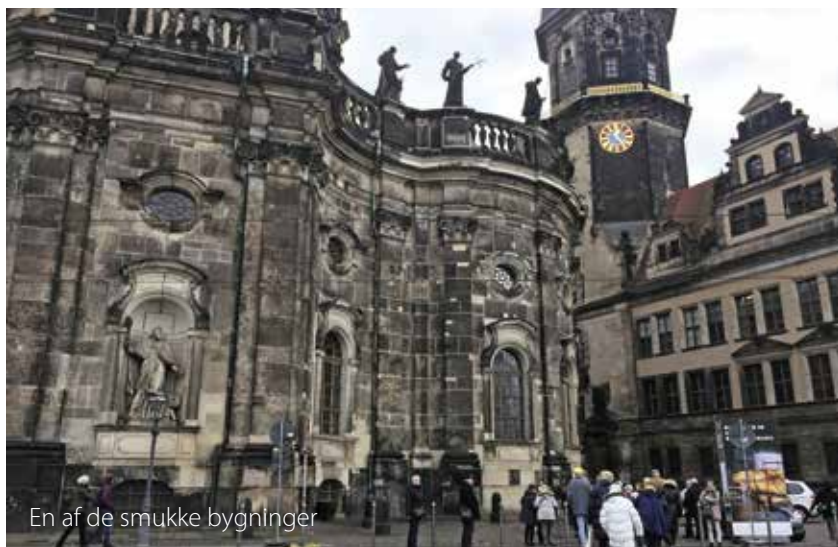
En af de smukke bygninger